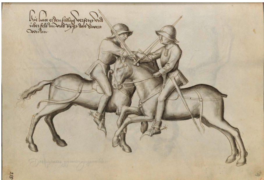
Ryc. 2. Konni szermierze uzbrojeni w hełmy i miecze – ok. 1467 r., Hans Talhoffer, Fechtbuch von 1467

funkcję półkopijników lub konnych szermierzy z bronią sieczną 17 . Pewnym uzupełnieniem jest również liczba 1623 koni strzelczych zapisanych w składach pocztów. Jeśli zaś chodzi o ceny omawianego uzbrojenia, to pewnych informacji dostarczają wypłaty odszkodowań za utraconą zbroję strzelczą, która wyceniana była na 90 gr. I tak np. w rejestrze strat podczas kampanii mołdawskiej odnotowanych zostało 79 zbroi strzelczych, utraconych przez jeźdźców dworskich 18 . W pierwszej połowie XVI w. koszty uzbrojenia strzelca konnego szacuje się na od ok. 90 gr za uzbrojenie zwykle do nawet ponad 300 gr za uzbrojenie dobre 19 .