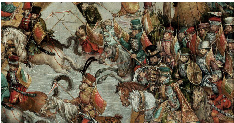
Ryc. 3. Jeźdźcy uzbrojeni „po racku”, Hans Krell, Bitwa pod Orszą 1524–1530 – fragment

w wojsku polskim, ciężkozbrojni kopijnicy zaczęli być zastępowani przez jazdę średniozbrojną i lekką 20 . Uzbrojenie wspomnianych jeźdźców wzorowane było na lekkiej konnicy Serbów bałkańskich – w Polsce nazywanych Racami 21 . Jako swojej głównej broni Racowie używali lekkich i poręcznych kopii, często zwieńczonych proporcami. W drugiej połowie XVI w. ceny takich kopii wynosiły od 8 do 20 gr 22 . W skład wyposażenia rackiego, poza kopią, wchodziły początkowo jedynie duża, asymetryczna tarcza oraz szabla 23 .