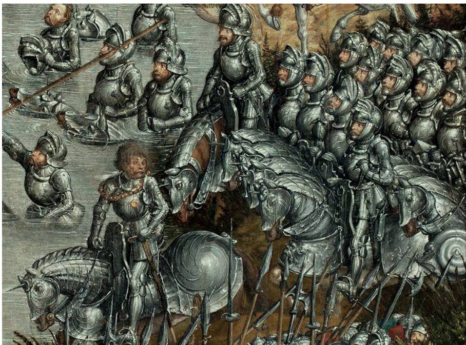
Ryc. 1. Jeźdźcy w zbrojach kopijniczych, Hans Krell, Bitwa pod Orszą 1524–1530 – fragment

zasadniczo brakuje informacji przedstawiających stan lub wygląd posiadanych przez kopijników zbroi. Jedynie raz odnotowano, że zbroja kopijnicza była „dobra” 10 .