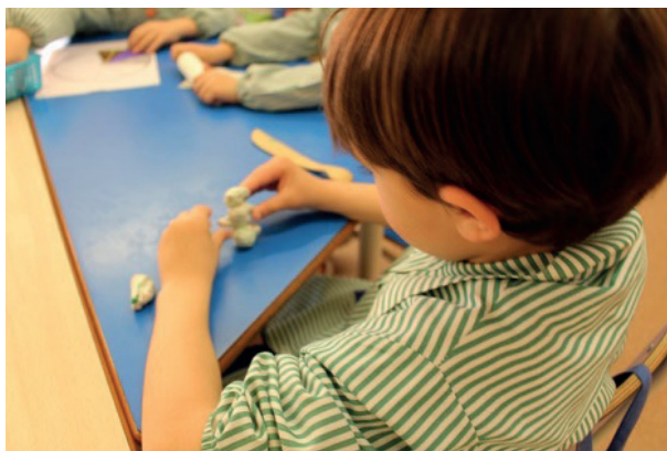
Fot. 1. Przełożenie dziecięcych wyobrażeń na formę plastyczną

Historia narodzin DT niewątpliwie ma związek z poszukiwaniem sposobu/procesu/metody dotarcia do przyrodzonych każdemu człowiekowi źródeł kreatywności i pomysłowości, które w toku nadmiernie sformalizowanego procesu edukacji zostają najczęściej pozbawione pierwotnej mocy swego oddziaływania. „Chodzi o to, by nie bacząc na istniejące, obowiązujące kanony, style i zasady, oraz nie czyniąc różnic między dziełem sztuki, wynalazkiem, przedmiotem użytkowym, narzędziem, tworzyć różnorodne obiekty, tak jak czynią to dzieci, sięgając po plastelinę” 2 .