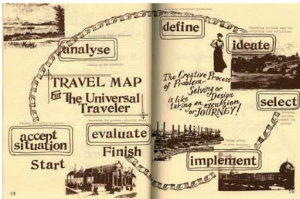
Fot. 2. Proces twórczy według D. Koberga i J. Bagnalla – ujęcie graficzne