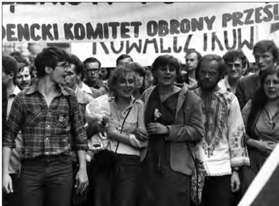
Fot. 80. Protestujący studenci (1981 r.).