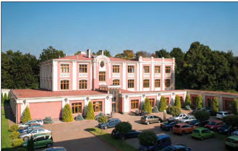
Fot. 54. Wydział Nauk o Wychowaniu przy ul. Pomorskiej 46/48 (2008 r.)