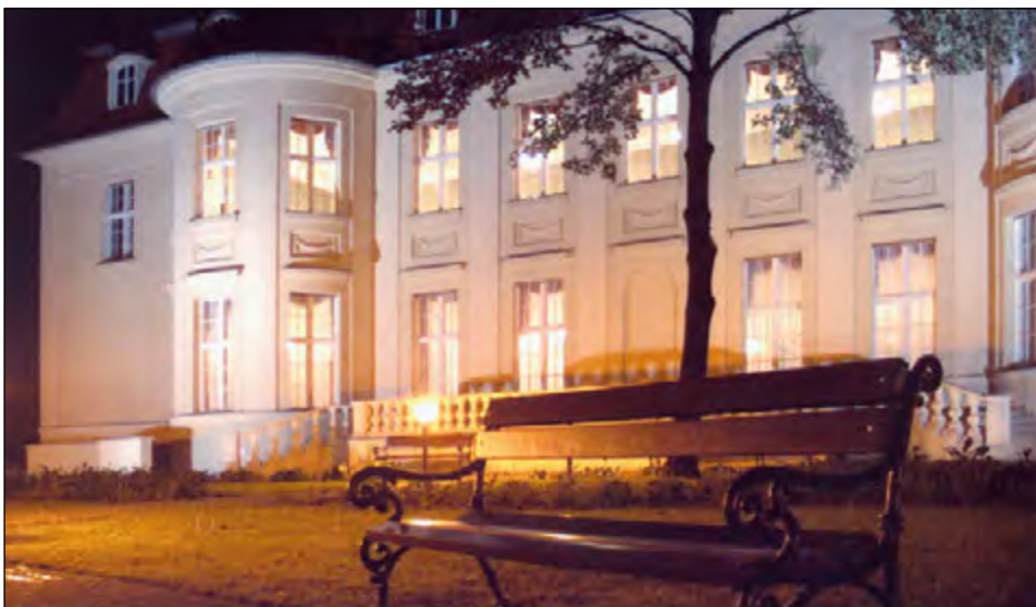
Fot. 62. Pałac Biedermanna, m.in. reprezentacyjne pomieszczenia rektora UŁ, Muzeum UŁ (Archiwum i Muzeum UŁ)