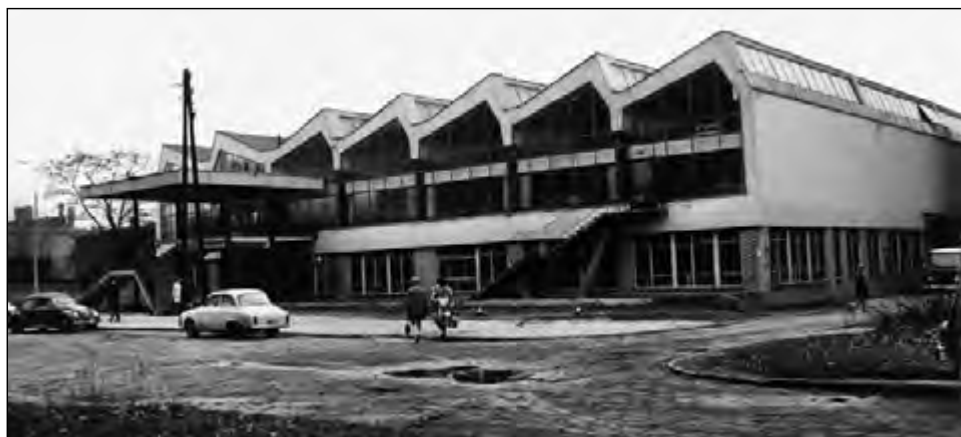
Fot. 11. Nowa stołówka na osiedlu akademickim (ok. 1965 r.)

W 1967 r. rozpoczęto budowę stołówki studenckiej na osiedlu przy ul. Lumumby. W latach 1966–1970 planowano wybudowanie gmachów fizyki, chemii, matematyki i geografii 70 .