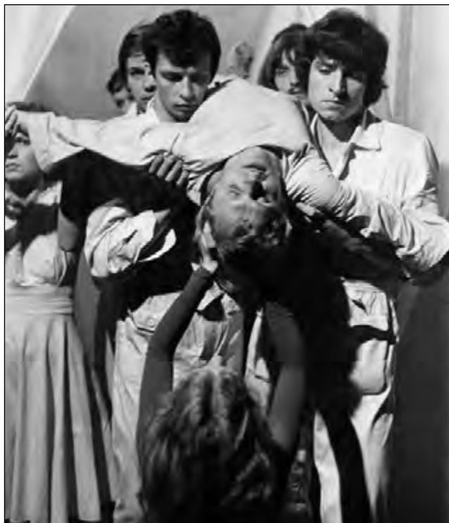
Fot. 76. Studencki Teatr Satyry „Pstrąg” – podczas przedstawienia „W poszukiwaniu koloru”

Poprawa sytuacji politycznej w środowisku uniwersyteckim po wydarzeniach październikowych doprowadziła jednocześnie do poważnych kłopotów w organizacji partyjnej i ZMP. Praktycznie organizacja Związku Młodzieży Polskiej przestała istnieć, natomiast w PZPR nastąpił spadek liczby członków z 241 w 1955 r. do 167 jesienią 1956 r. i 153 w 1958 r. Wśród osób odchodzących z partii przeważali studenci oraz młodzi pracownicy naukowo-dydaktyczni, głównie kandydaci PZPR 36 .