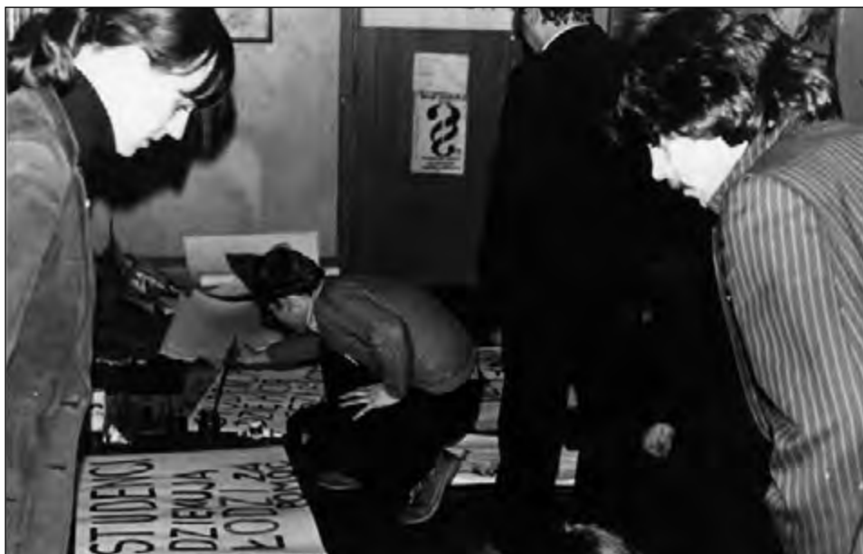
Fot. 83. Strajk studentów 1981 r. Przygotowywanie plakatów.