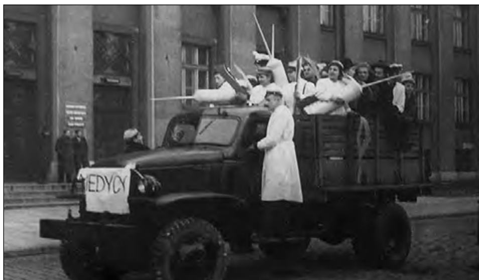
Fot. 73. Święto studentów łódzkich uczelni w 1946 roku