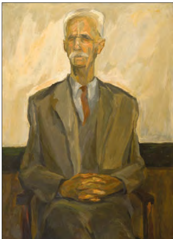
Fot. 86. Prof. Tadeusz Kotarbiński.

otrzymał wstępną nominację na rektora Uniwersytetu Łódzkiego (formalnie nominację podpisał B. Bierut 16 września 1945 r.). Obowiązki rektora nowego Uniwersytetu przejął od tzw. Komisji Kierującej 15 lipca 1945 r. Funkcję rektora UŁ sprawował do końca roku akademickiego 1948/1949. Profesor T. Kotarbiński był zwolennikiem uniwersytetu liberalnego, w którym naczelnym hasłem badań naukowych i prowadzenia wykładów jest „wolność i prawda”. W okresie jego kadencji UŁ rozwijał się znakomicie, w okresie do 1949 r. był drugą po Uniwersytecie Jagiellońskim uczelnią pod względem liczby studentów. Niestety hasła zbudowania w Łodzi „socjalistycznego uniwersytetu robotniczej Łodzi” doprowadziły do odejścia ze stanowiska rektora prof. T. Kotarbińskiego. Pozostał jednak w Łodzi jeszcze do roku akademickiego 1951/1952 jako kierownik Katedry Filozofii. Już po odwilży październikowej, w 1957 r. Senat Uniwersytetu Łódzkiego nadał prof. T. Kotarbińskiemu tytuł doktora honoris causa .