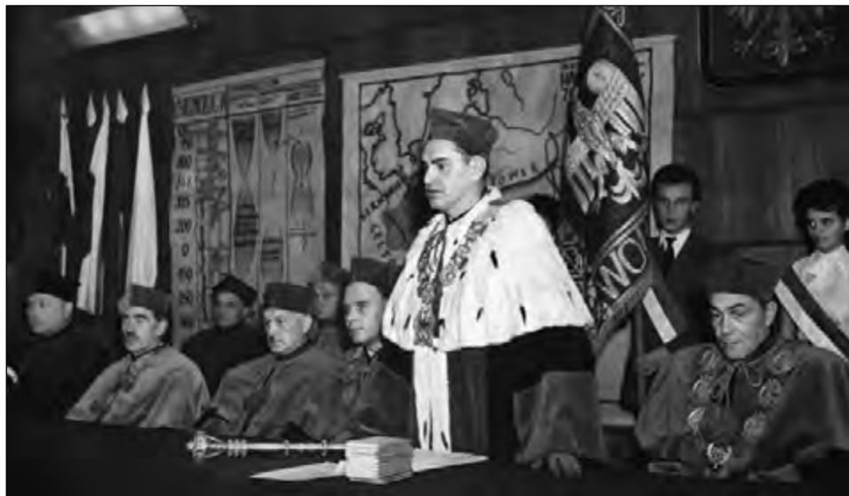
Fot. 8. Inauguracja roku akademickiego (druga połowa lat 50. XX w.)