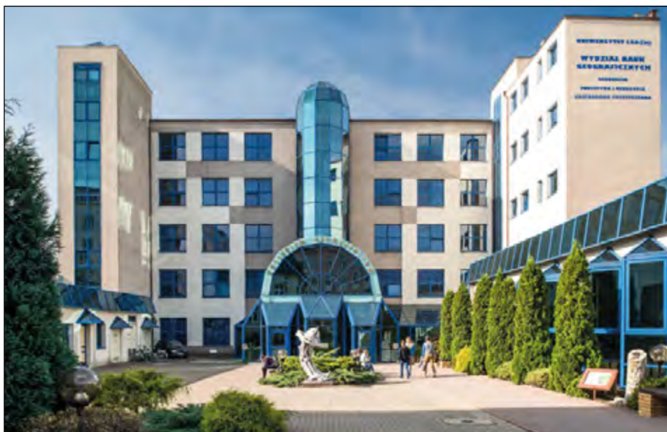
Fot. 53. Wydział Nauk Geograficznych przy ul. Kopcińskiego 31 (2008 r.)