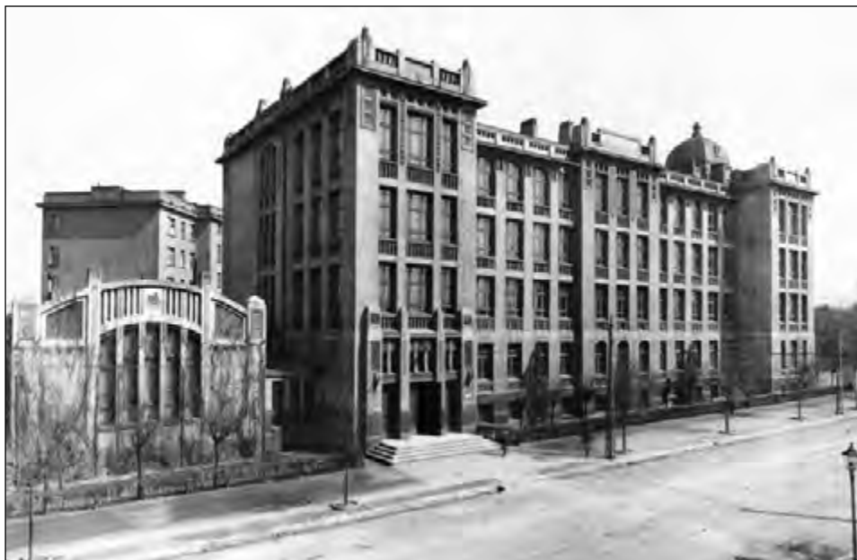
Fot. 3. Pierwszy budynek UŁ z 1945 r. przy ul. Narutowicza 68, pozyskany na własność gmach byłej Szkoły Zgromadzenia Kupców (przed 1945 r.)

Bibliotekę Uniwersytecką. Bibliotece tej przydzielono lokal pofabryczny przy al. Kościuszki 10, pozbawiony centralnego ogrzewania, podłączenia do wodociągów i kanalizacji, a w części także okien. Mógł spełniać jedynie funkcję magazynu. W związku z tym duże znaczenie miało pozyskanie, najpierw części, a od 1948 r. całego, budynku przy ul. Narutowicza 59a (późniejszy budynek Wydziału Prawa), w którym urządzono czytelnie i w części podręczny magazyn. Już od momentu powołania biblioteki, a więc od lutego 1945 r., pracownicy powstającej uczelni rozpoczęli akcję zdobywania książek. Jak pisał prof. B. Baranowski, „Ściągano je zarówno z Łodzi i jej okolic, jak i z Ziemi Zachodnich. Akcja ta była prowadzona z wielką ofiarnością przez pierwszych pracowników Biblioteki” 24 . Po utworzeniu Uniwersytetu Łódzkiego w maju 1945 r., Bibliotece Uniwersyteckiej przyznano prawo otrzymywania tzw. egzemplarza obowiązkowego. Mimo pewnych kłopotów w pierwszych latach, od 1947 r. wydawnictwa regularnie nadsyłały wszystkie wydawane pozycje. Warto także wspomnieć o przekazywanych darach, które w sumie wyniosły 68 tysięcy tomów. Były to książki przekazane przez Związek Patriotów Polskich w Moskwie – 23 500 tomów; społeczeństwo polskie z Wilna – 7500