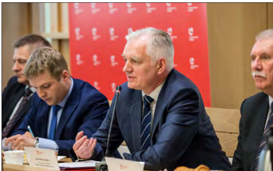
Fot. 37. Wicepremier, minister nauki i szkolnictwa wyższego Jarosław Gowin na Uniwersytecie Łódzkim (2019 r.)

stanowisko Senatu UŁ w sprawie projektu ustawy ministra J. Gowina było najbardziej krytyczne w skali całego środowiska akademickiego w Polsce. Zapewne ten fakt zdecydował o wizycie wicepremiera J. Gowina w Uniwersytecie Łódzkim 16 kwietnia 2018 r., kiedy to wziął on udział w posiedzeniu Senatu naszej Uczelni. W trakcie zebrania sam wicepremier oraz towarzyszący mu asystent próbowali rozwiać obawy członków Senatu dotyczące treści wielu zapisów ustawy krytycznie ocenionej w wyżej cytowanej uchwale. Jak wiadomo, w tym czasie w projekcie nastąpiły pewne zmiany, przede wszystkim zmieniono przyszły skład tzw. rady uczelni, rezygnując z przewagi w jej składzie osób spoza uczelni, nieznacznie ograniczono także jej kompetencje. Rozmowa i dyskusja Senatu UŁ z wicepremierem J. Gowinem w niewielkim tylko stopniu przekonała zebranych, generalnie środowisko naukowe naszej Uczelni pozostało krytyczne wobec proponowanej ustawy 203 .