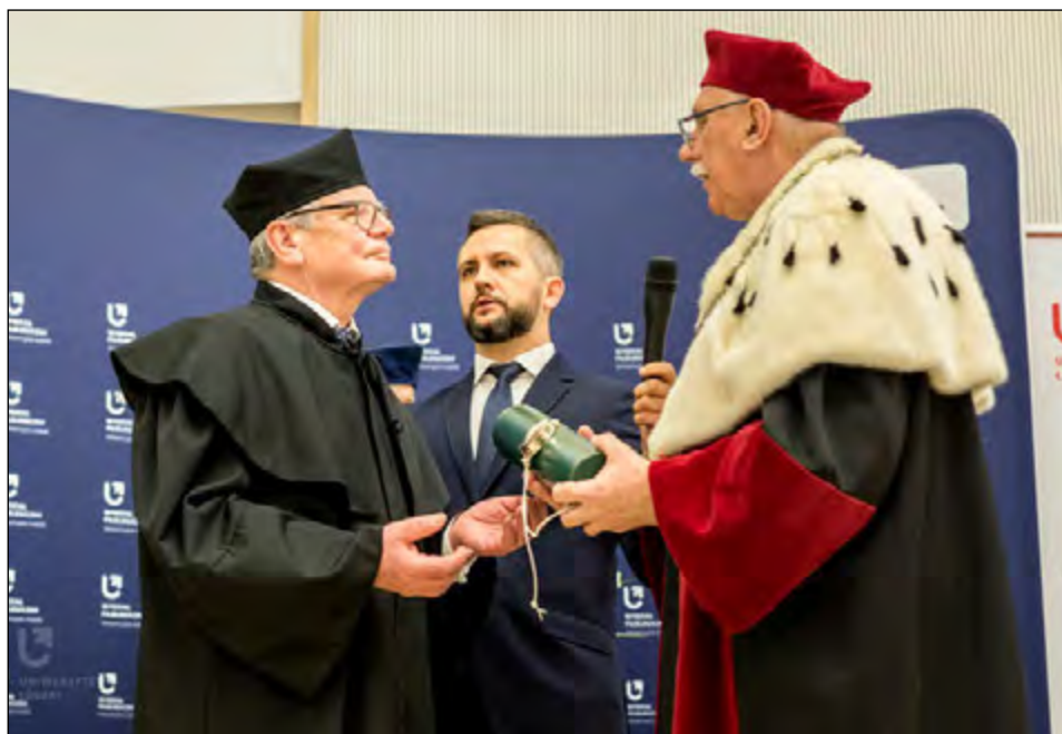
Fot. 42. Doktorat h.c. dla Joachima Gaucka (2019 r.).