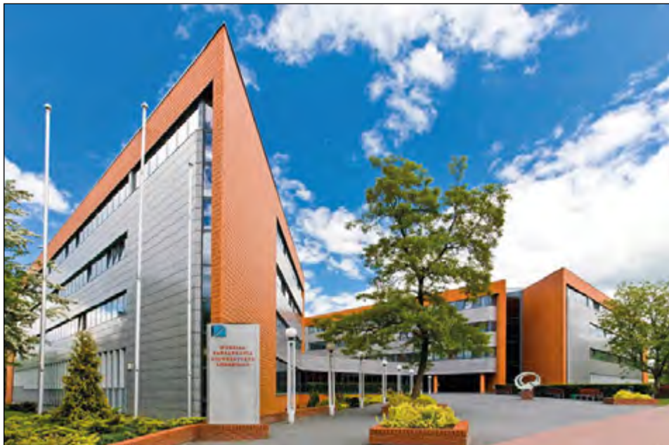
Fot. 58. Wydział Zarządzania przy ul. Jana Matejki 22/26 (2008 r.)

Produkcji i Gospodarki Materiałowej; Zakład Przedsiębiorczości i Polityki Przemysłowej, którym kierował prof. Bogdan Piasecki 138 .