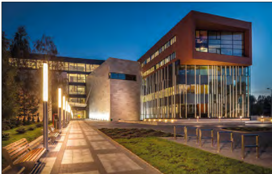
Fot. 49. Wydział Filologiczny przy ul. Pomorskiej 171/173 (2008 r.)