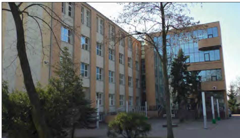
Fot. 50. Wydział Filozoficzno-Historyczny przy ul. Kamińskiego 27a (2015 r.)