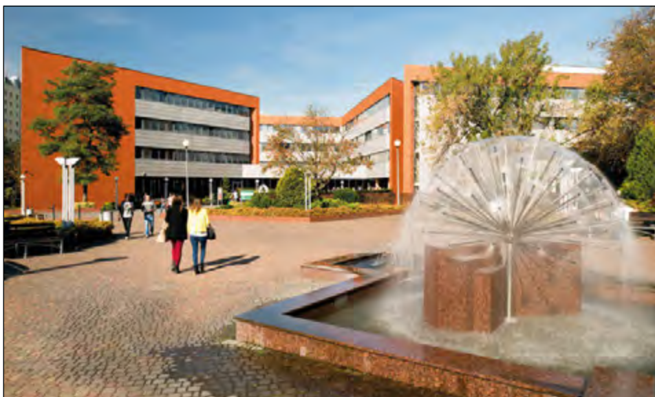
Fot. 27. Wydział Zarządzania przy ul. Matejki 22/26.