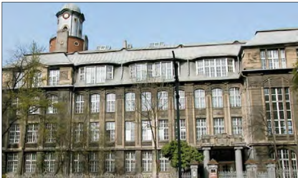
Fot. 14. Gmach Wydziału Filologicznego w budynku dawnego Gimnazjum Niemieckiego przy al. Kościuszki 65

Realizacja hasła „otwartego uniwersytetu” rektora J. Górskiego polegała na poszerzaniu możliwości kształcenia nie tylko poprzez wzrost liczby studentów, ale również poprzez prowadzenie studiów zaocznych poza Łodzią, w tzw. punktach konsultacyjnych. Zajęcia odbywały się w ośmiu punktach konsultacyjnych: w Piotrkowie Trybunalskim, Sieradzu, Kaliszu, Kutnie, Skierniewicach, Tomaszowie Mazowieckim, Zgierzu i we Włocławku, a więc w tzw. szeroko pojętym regionie centralnym. W okresie kadencji rektora J. Górskiego szybko rosła liczba studentów. W 1974 r. na 26 kierunkach studiowały 14 242 osoby, w tym na studiach dziennych 7630 osób, na zaocznych 6069 osób i na studiach podyplomowych 543 osoby. Wzrost limitów przyjęć na studia oraz prowadzenie zajęć poza Łodzią wymagały zwiększenia liczby nauczycieli akademickich. W 1974 r. liczba pracowników naukowo-dydaktycznych zwiększyła się z 1125 w 1972 r. do 1163. Przybyło głównie adiunktów oraz asystentów, natomiast w grupie samodzielnych pracowników naukowych (profesorowie i docenci), których ogółem było 180, liczba profesorów zwyczajnych w stosunku do 1969 r. zmniejszyła się z 24 do 22. Generalnie w latach siedemdziesiątych XX w. poważnym problemem Uniwersytetu Łódzkiego był powolny przyrost habilitacji i tytułów profesorskich.