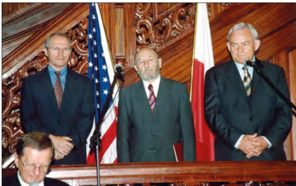
Fot. 29. Uroczystości w Pałacu Biedermanna z udziałem premiera Leszka Millera, ambasadora USA Christophera Hilla i rektora Wiesława Pusia – podpisanie umowy offsetowej – lipiec 2003 r. Ze zbiorów Archiwum UŁ