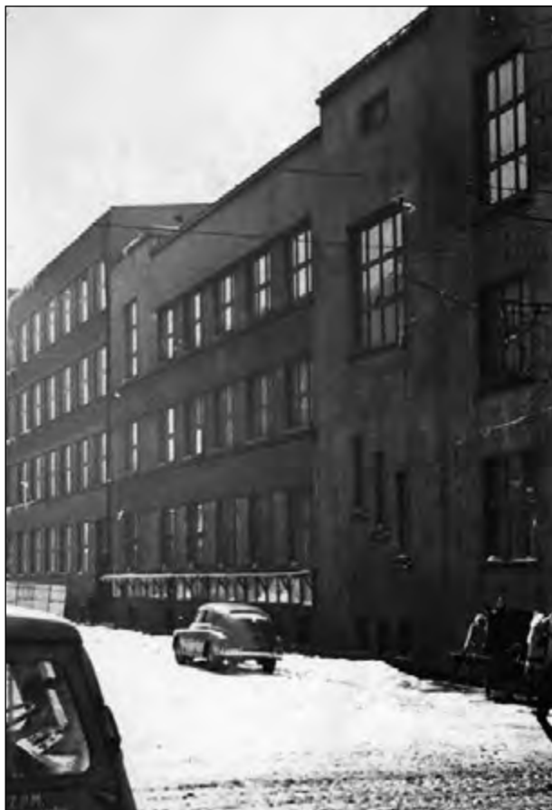
Fot. 2. Gmach wybudowany w 1929 r. dla pracowników biurowych wodociągów i kanalizacji w Łodzi przy ul. Narutowicza 65. Od 1946 r. – rektorat UŁ Ze zbiorów Archiwum UŁ

Wkrótce, z niewiadomych przyczyn, właściciel opuścił Łódź, a hotel „Monopol” od stycznia 1946 r. został zamieniony na żeński akademik. Przez pewien czas władze organizującej się uczelni dysponowały lokalami Technikum Włókienniczego przy ul. Żeromskiego 115. W budynku tej szkoły oraz w wynajmowanych salach kinowych w mieście, a także salach Sądu Wojewódzkiego przy pl. Dąbrowskiego odbywały się wykłady. Jeszcze w 1945 r., nowo powstała uczelnia otrzymała budynek przedwojennego Gimnazjum Zgromadzenia Kupców przy ul. Narutowicza 68, w którym urzędował rektor T. Kotarbiński i administracja Uniwersytetu Łódzkiego. Z kolei w końcu września 1945 r., przydzielono Uczelni budynek przy ul. Narutowicza 65 (Lindleya 1) oraz Lindleya 3/5, zajmowany