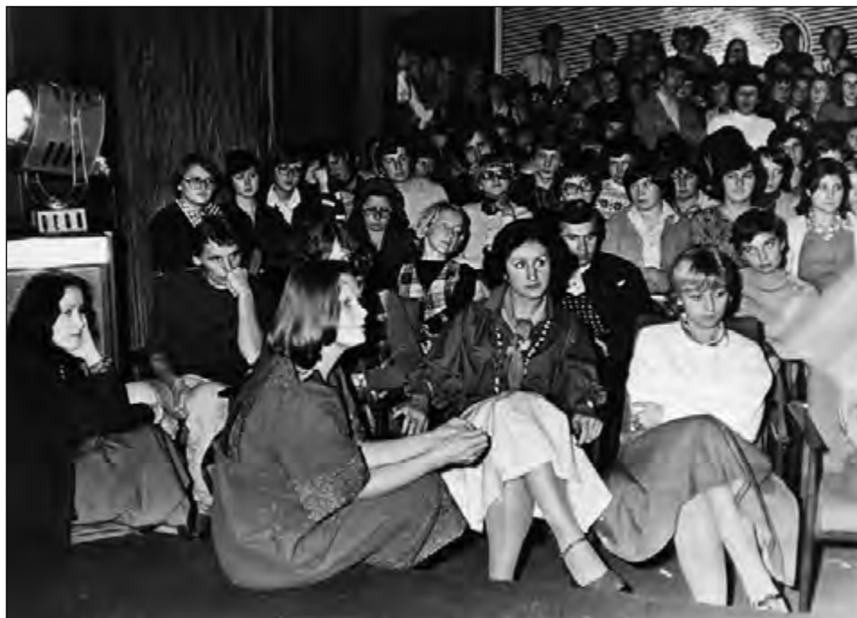
Fot. 79. Spotkanie z Beatą Tyszkiewicz w klubie Hades (lata 70. XX w.)

Dramatyczne wydarzenia w grudniu 1970 r. na Wybrzeżu, mimo ogromnego zaniepokojenia w środowisku uczelnianym, nie wywołały wystąpień wśród młodzieży akademickiej. Wydaje się, że zadecydowała o tym szybka zmiana na stanowisku I sekretarza KC PZPR (Edward Gierek zastąpił Władysława Gomułkę), ale również rozpoczęcie ferii świątecznych.