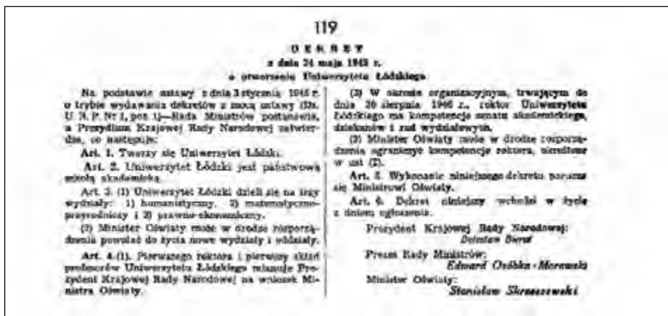
Fot. 1. Dekret o utworzeniu Uniwersytetu Łódzkiego „Dziennik Ustaw RP” z dnia 11 czerwca 1945, nr 21, poz. 119

Art. 6. Wykonanie niniejszego dekretu porucza się Ministrowi Oświaty.