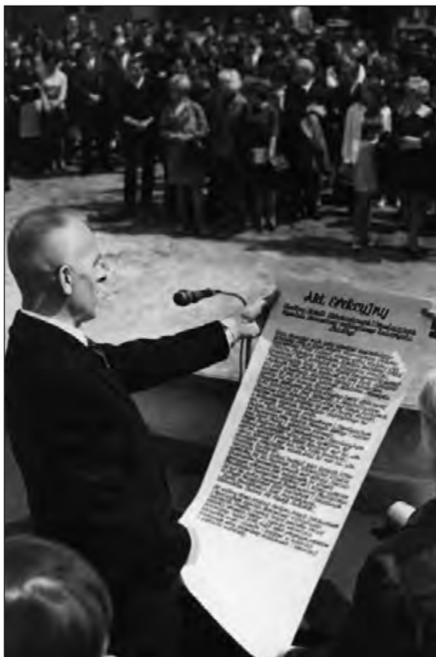
Fot. 10. Odczytanie Aktu erekcyjnego przy budowie nowego pawilonu Wydziału Ekonomiczno-Socjologicznego UŁ

Mimo ciągnących się kłopotów inwestycyjnych, o czym dyskutowano w latach 1965–1968 na kolejnych posiedzeniach senatu UŁ, rektor J. St. Piątowski mógł odnotować znaczne sukcesy w tej sferze funkcjonowania uczelni. W latach 1965–1967 wybudowano gmach biologii o powierzchni użytkowej 9813 m 2 , w latach 1965–1966 na osiedlu studenckim przy ul. Lumumby dwa domy akademickie – nr VII o powierzchni 3219 m 2 i nr VIII o powierzchni 3219 m 2 , w latach 1965–1967 rozbudowano (nowe skrzydło) gmach Wydziału Ekonomiczno-Socjologicznego o powierzchni 6645 m 2 przy ul. Rewolucji 1905 r., w latach 1967–1968 wybudowano kolejny akademik, nr V, o powierzchni 3219 m 2 , w latach 1966–1967 pawilony usługowe na osiedlu studenckim przy ul. Lumumby o powierzchni 710 m 2 .