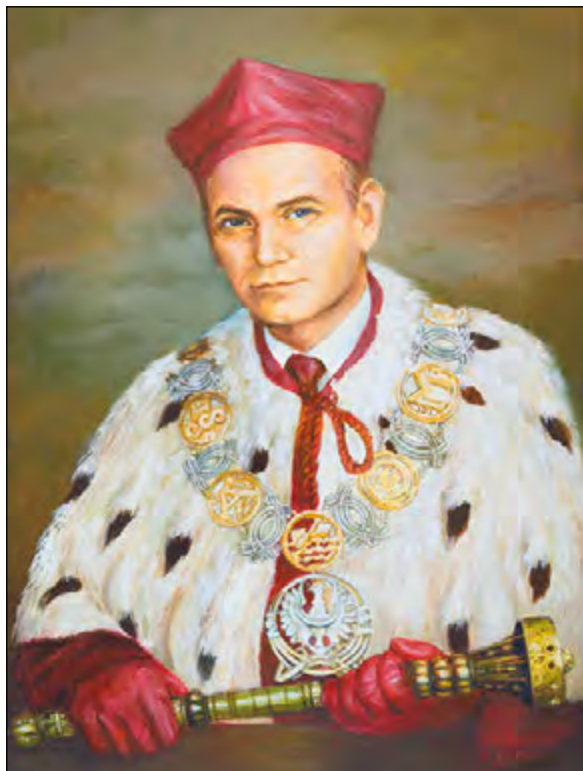
Fot. 95. Prof. Janusz Górski.

studentów wypowiedzi ministra J. Górskiego, potrafił on jednak doprowadzić do podpisania porozumienia, które zadowalało obie strony, a jego efektem było przywrócenie częściowej autonomii szkolnictwa wyższego.