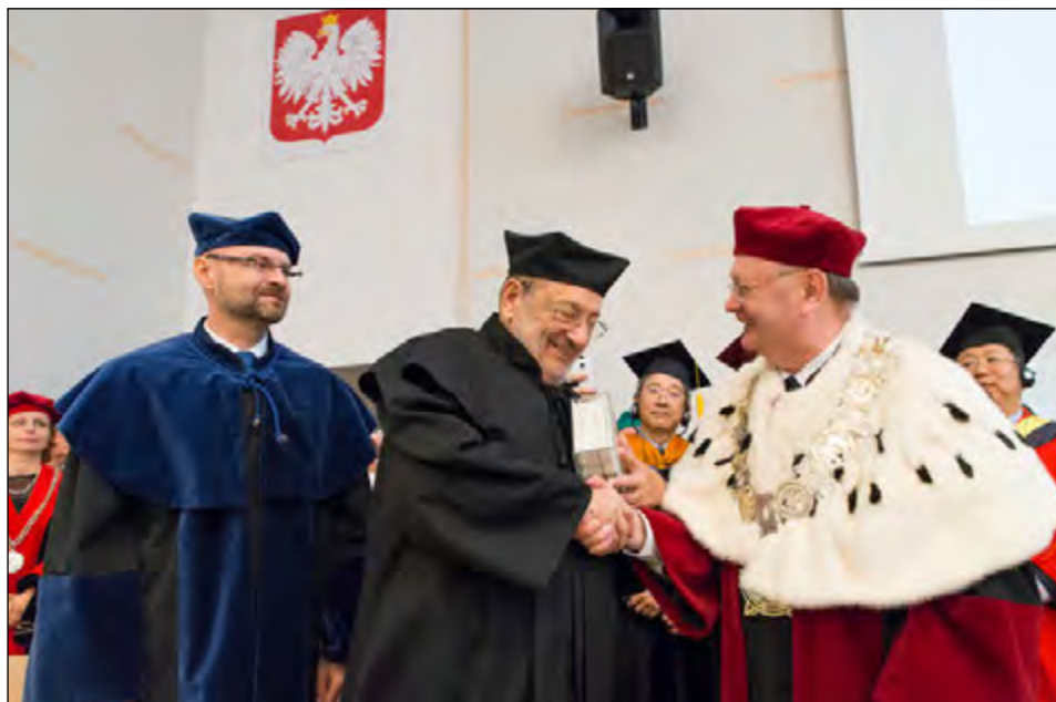
Fot. 33. Uroczystość nadania doktoratu h.c. UŁ dla Umberto Eco, włoskiego powieściopisarza i filozofa (2015 r.)