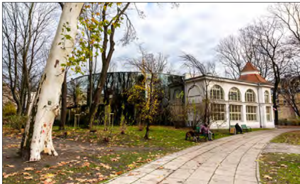
Fot. 40. Otwarcie wyremontowanego Muzeum Przyrodniczego UŁ (15 listopada 2018 r.)