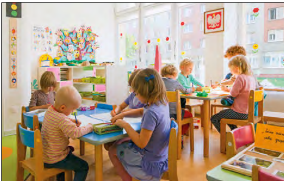
Fot. 63. Przedszkole UŁ na osiedlu akademickim (2014 r.).