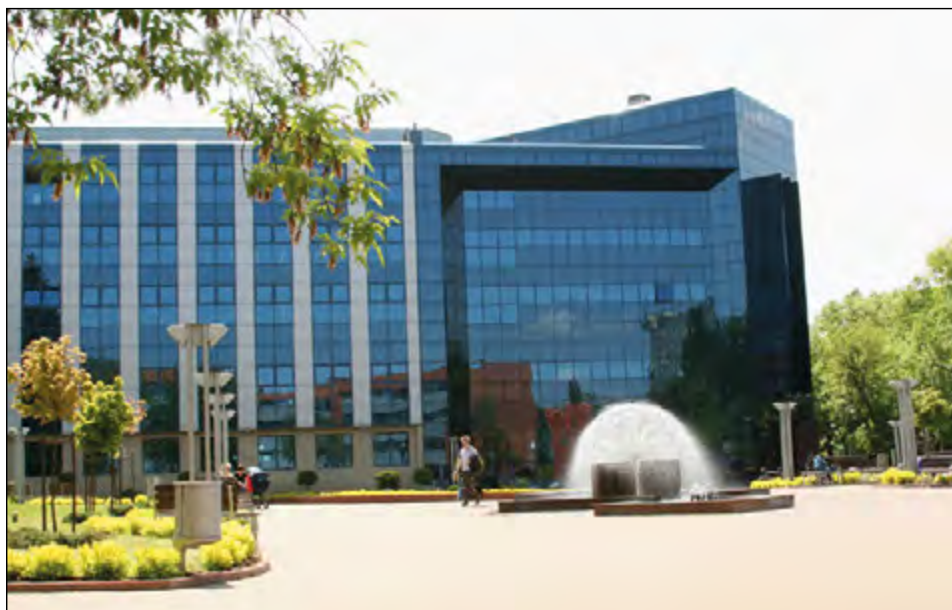
Fot. 30. Nowa część BUŁ przy ul. Jana Matejki 32/38 (2008 r.).