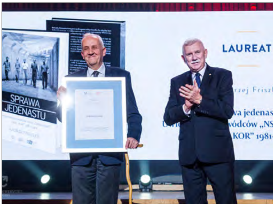
Fot. 38. Laureat Nagrody im. Tadeusza Kotarbińskiego – prof. Andrzej Friszke (2018 r.) Ze zbiorów Archiwum UE

i Politologicznych; Lwowskim Uniwersytetem Katolickim (Ukraina), Wydział Filozoficzno-Historyczny; Uniwersytetem w Neapolu (Włochy), Wydział Chemii. W następnym, 2019, roku zawarto kolejnych 15 umów bilateralnych. Poza porozumieniami ramowymi nasza Uczelnia utrzymuje partnerskie stosunki z 16 uczelniami partnerskimi w ramach międzynarodowych umów formalnych. Są to następujące uniwersytety i instytucje naukowe: Uniwersytet im. Justusa Liebiga w Giessen (Niemcy); Uniwersytet w Jenie (Niemcy); Uniwersytet w Ratyzbonie (Niemcy); Uniwersytet Hydrometeorologiczny w St. Petersburgu (Rosja); Uniwersytet Paryż 13 (Francja); Uniwersytet w Ostrawie (Czechy); Uniwersytet Wileński (Litwa); International Bureau of Fiscal Documentation (IBFD) w Amsterdamie (Holandia); Centria University of Applied Sciences w Kokkola (Finlandia); Przykarpaccy Uniwersytet Narodowy im. Wasyla Stefanyka w Iwanofrankiwsku (Ukraina); University of Chicago oraz University of Virginia (USA); Uniwersytet Kwansei Gakuin (Japonia); Uniwersytet im. Mateja Bela w Bańskiej Bystrzycy (Słowacja), Uniwersytet Finansów i Ekonomii w Shandong (Chiny); Zhengzhou University (Chiny); Shanghai Lixin University of Accounting and Finance (Chiny).