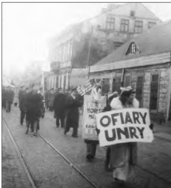
Fot. 71. Święto studentów łódzkich uczelni w 1946 roku