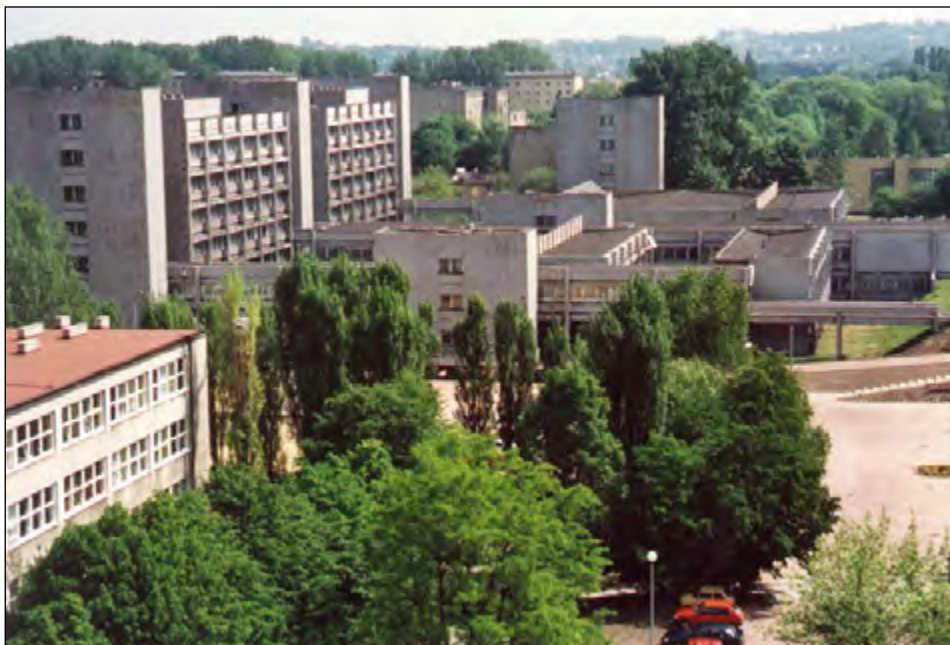
Fot. 20. Instytut Fizyki (początek lat 80. XX w.).