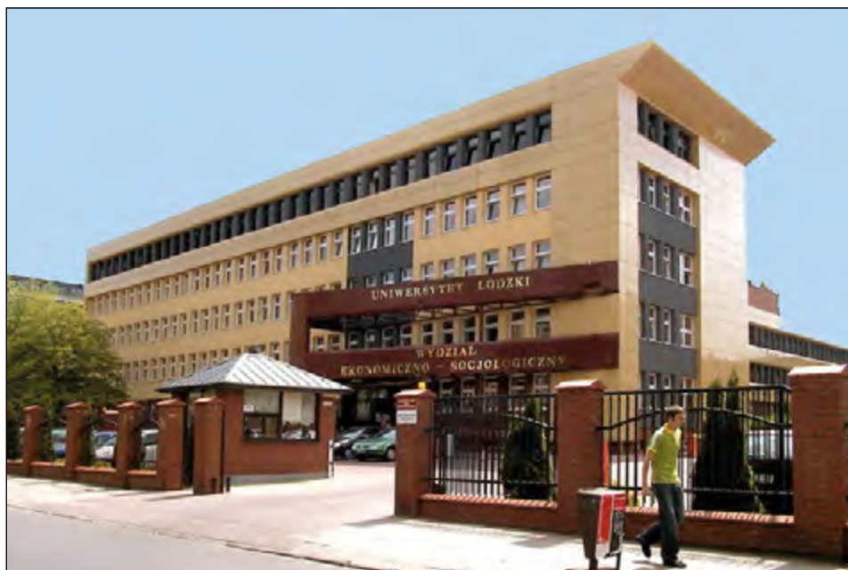
Fot. 47. Wydział Ekonomiczno-Socjologiczny przy ul. Rewolucji 1905 roku 41 (2008 r.)