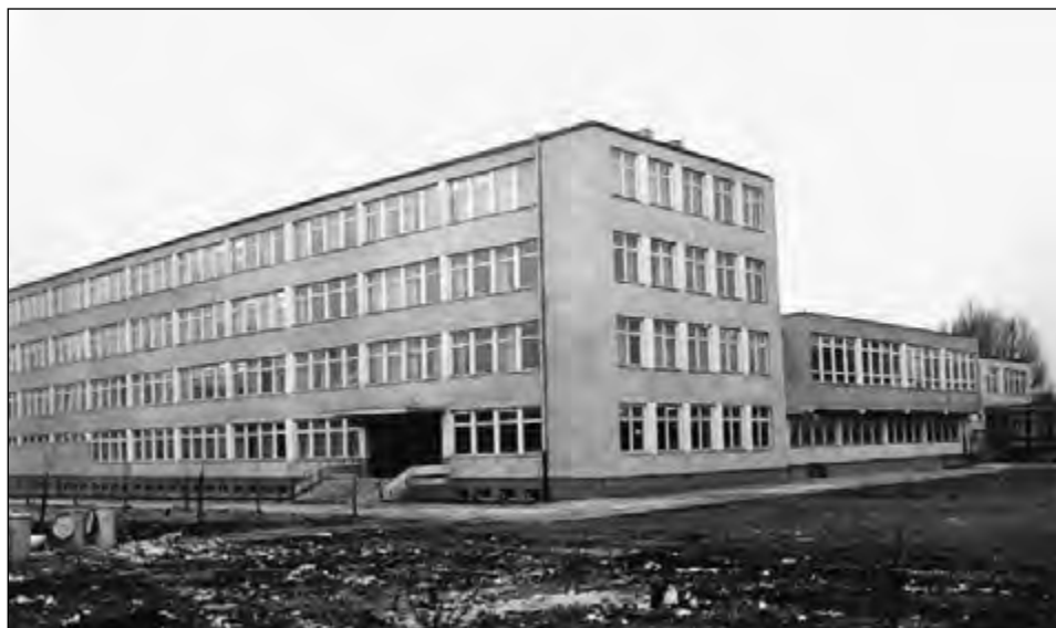
Fot. 12. Instytut Matematyki (ok. 1970 r.).

z silną władzą dyrektora. W ten sposób utworzono w Uniwersytecie Łódzkim 21 instytutów. Katedry pozostawiono jedynie na małych kierunkach, a mianowicie na archeologii, etnografii, filologii klasycznej i na filologii romańskiej. Ponadto władze ministerialne dążyły do unifikacji planów i programów studiów, przesyłając do uczelni „sugestie programowe”, które należało bezwzględnie realizować 82 .