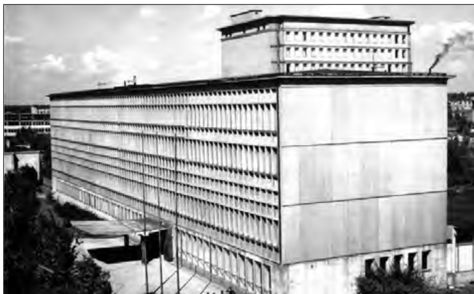
Fot. 6. Nowy gmach Biblioteki UŁ (1960 r.)

Lata 1956–1962 były okresem najpoważniejszych inwestycji w dotychczasowej historii Uniwersytetu Łódzkiego. Przede wszystkim w 1960 r. oddano do użytku nowoczesną na owe czasy Bibliotekę Uniwersytecką przy ul. Matejki 34. Gmach ten, o powierzchni użytkowej 12 950 m 2 , był budowany w latach 1955–1960. Kolejny obiekt to budynek Katedry Mikrobiologii, który został rozbudowany w latach 1959–1960. W latach 1958–1962 powstał z kolei dom mieszkalny dla pracowników Uniwersytetu Łódzkiego i Politechniki Łódzkiej przy ul. Wierzbowej. Przy udziale Uniwersytetu Łódzkiego w latach 1957–1959 zbudowano stadion sportowy AZS-u przy ul. Styrskiej 22 (później Lumumby). W 1962 r. rozpoczęto budowę gmachu Studium Języka Polskiego dla Cudzoziemców, o powierzchni 6690 metrów kwadratowych, przy ul. Kopcińskiego 16/18 55 .