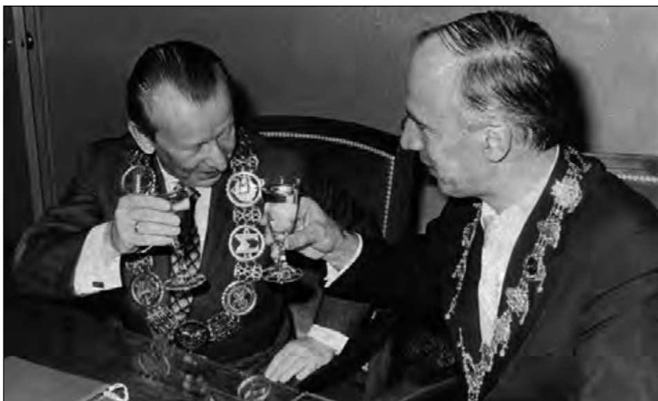
Fot. 17. Po podpisaniu umowy o bezpośredniej współpracy pomiędzy Uniwersytetem im. Justusa Liebiga w Giessen a Uniwersytetem Łódzkim w roku 1978

energicznym, a jednocześnie zręcznym rektorem, który potrafił znakomicie kierować Uczelnią w bardzo trudnych czasach. Doskonale rozumiał konieczność zmian ustawowych w szkolnictwie wyższym, które winny przywrócić uczelniom autonomię. Dlatego też popierał dążenia studentów w czasie słynnego strajku i negocjacji z Komisją Resortową.