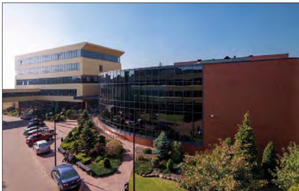
Fot. 48. Wydział Ekonomiczno-Socjologiczny przy ul. Rewolucji 1905 roku 39 (2008 r.)