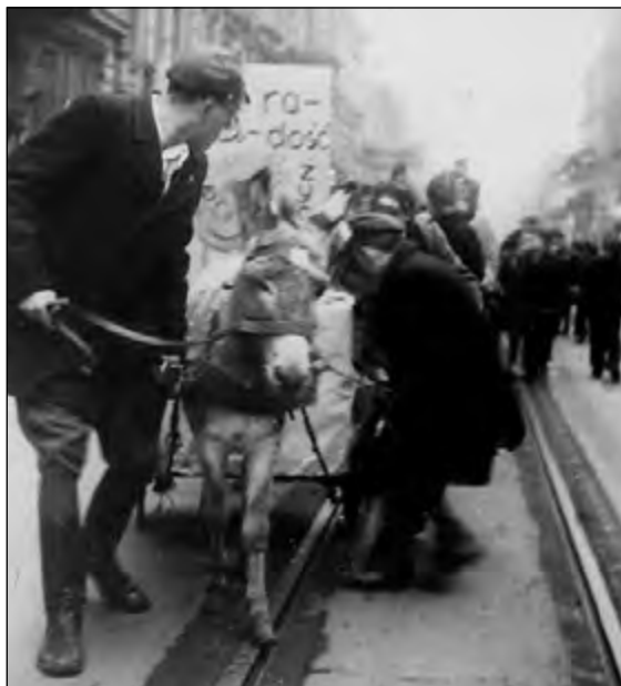
Fot. 70. Święto studentów łódzkich uczelni w 1946 roku