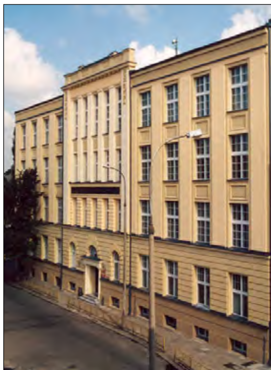
Fot. 57. Wydział Studiów Międzynarodowych i Politologicznych przy ul. Składowej 43 (2008 r.)