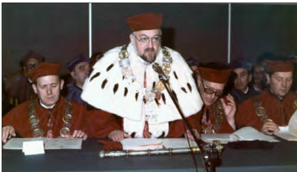
Fot. 21. Inauguracja roku akademickiego 1987/1988