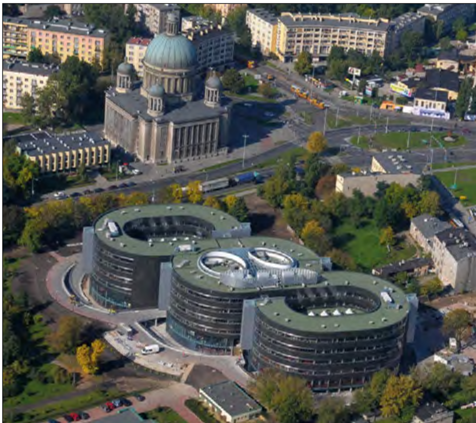
Fot. 56. Widok na Wydział Prawa i Administracji oraz kościół pw. św. Teresy i św. Jana Bosko (2014 r.)