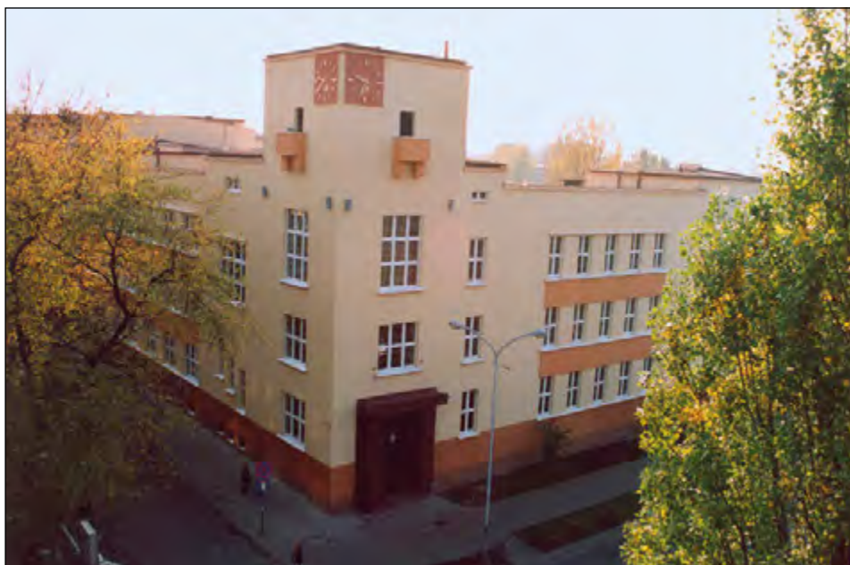
Fot. 64. Rektorat przy ul. Narutowicza 65 (ok. 2013 r.).