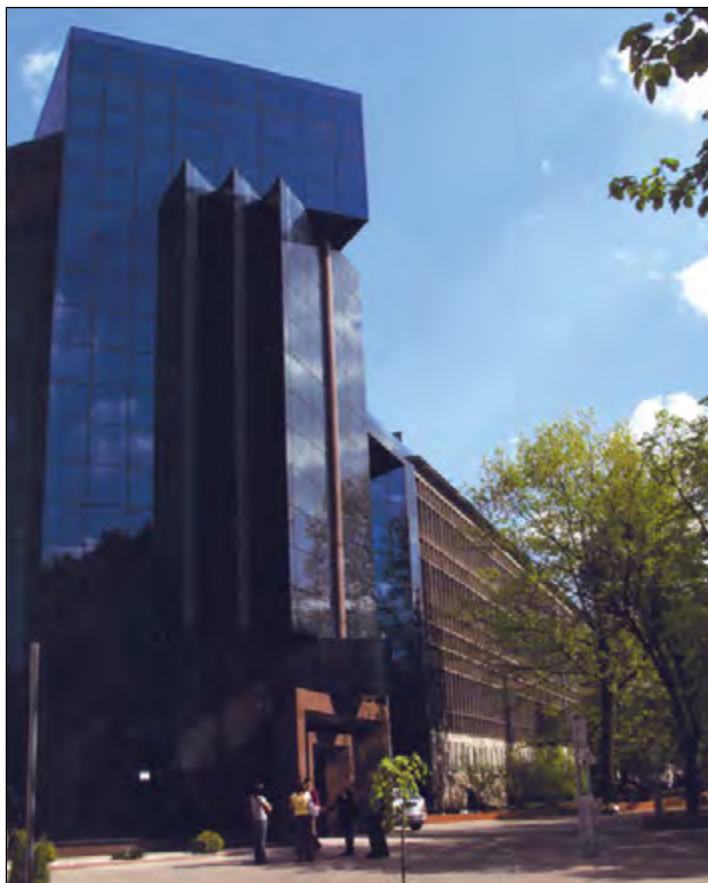
Fot. 59. Fragment części starej i nowej Biblioteki Uniwersytetu Łódzkiego przy ul. Jana Matejki 32/38 (2008 r.)

gmachu zastosowano wolny dostęp do zbiorów, co w poważnym stopniu zmieniło dotychczasową organizację przestrzenną, a także organizację udostępniania i obsługi informacyjnej czytelników. Wprowadzono bezprzewodowy internet, wielostanowiskowy dostęp do elektronicznych źródeł informacji (także domowy) oraz dostęp w nowo utworzonej czytelnicy do powiększającej się systematycznie liczby skanów i mikrofilmów. Znaczna część zbiorów została zdigitalizowana, są więc one dostępne w sieci 152 . Obecnie Biblioteka Uniwersytecka zgromadziła księgozbiór liczący około trzy miliony tomów.