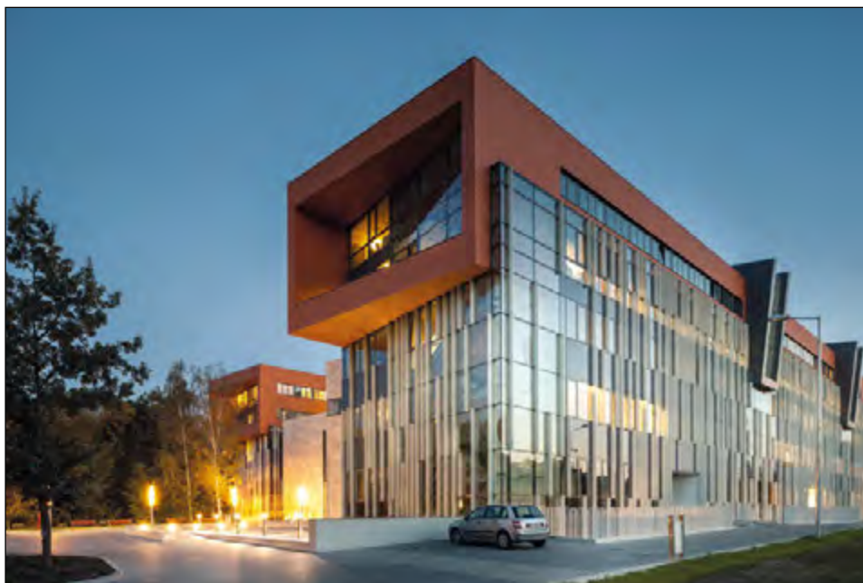
Fot. 35. Nowy budynek Wydziału Filologicznego przy ul. Pomorskiej 171/173 (2014 r.)