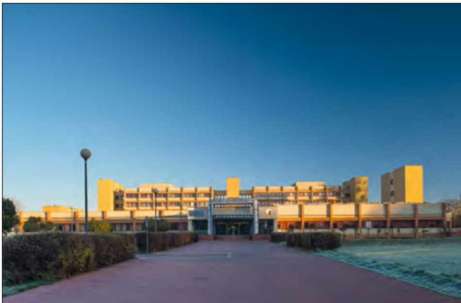
Fot. 51. Wydział Fizyki i Informatyki Stosowanej przy ul. Pomorskiej 141/153 (2014 r.)

kierunku fizyki wprowadzono również specjalności: fizykę medyczną oraz fizykę informatyczną. Obecnie na Wydziale FiIS działają następujące kierunki i specjalności w systemie dwustopniowym (studia licencjackie I stopnia i magisterskie II stopnia): informatyka, informatyka studia inżynierskie 3,5-letnie oraz 1,5-letnie magisterskie, fizyka, Międzywydziałowe Studia Matematyczno-Przyrodnicze – licencjackie i magisterskie. Liczba studentów na Wydziale, a wcześniej na kierunkach prowadzonych przez fizyków, była w stosunku do innych wydziałów niewielka. W latach 2006–2009 liczba studentów zdecydowanie wzrosła (głównie dzięki informatyce) z 411 do 706. Przy czym liczba studentów studiów zaocznych (płatnych) stanowiła ponad 48% (341 z 706) ogółu. Niestety, również na tym wydziale widoczne są skutki niżu demograficznego, w 2014 r. liczba studentów spadła bowiem do 469, a w tej grupie studenci niestacjonarni stanowili zaledwie nieco ponad 16% (78 z 469) ogólnej liczby studiujących. W 2020 r. nastąpił pewien wzrost studentów – do 571 osób na wszystkich rodzajach studiów oraz 14 doktorantów 86 .