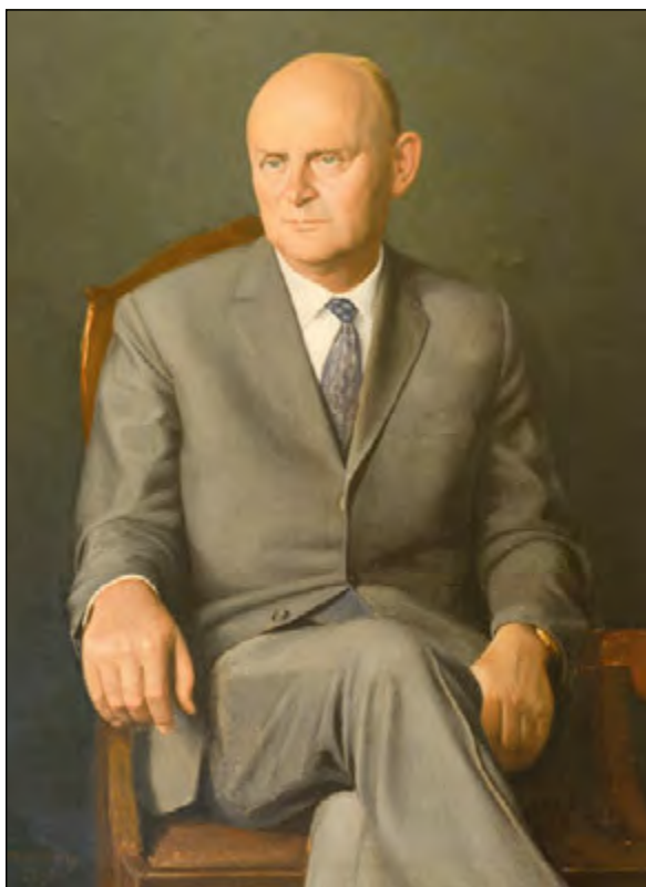
Fot. 88. Prof. Jan Szczepański.

Profesor J. Szczepański sprawował również funkcje prodziekana Wydziału Humanistycznego w latach 1950–1951 oraz organizatora Wydziału Filozoficzno-Społecznego w latach 1951–1952, a w 1952 r. został mianowany rektorem Uniwersytetu Łódzkiego. Warto dodać, że był najmłodszym, zaledwie 39-letnim, rektorem w dziejach naszej Uczelni. Przyszło mu kierować UŁ w niezwykle trudnym okresie, kiedy zlikwidowano większość kierunków humanistycznych, a także pojawiały się w ministerstwie pomysły, aby całą humanistykę przenieść do Torunia. Rektor J. Szczepański, w odróżnieniu od swego poprzednika rektora J. Chałasińskiego, był człowiekiem spokojnym, rozważnym, który nie tworzył rewolucyjnych wizji „socjalistycznego uniwersytetu”. Był oczywiście lojalny wobec ministerstwa i władz politycznych, ale zarazem był osobą niezwykle konkretną. Zyskał sobie taką postawą uznanie władz i dzięki temu UŁ już w latach 1955–1956 zaczął stopniowo wychodzić z sytuacji kryzysowej. Rektor J. Szczepański uzyskał w 1955 r. zgodę na jedną z najważniejszych inwestycji, jaką była budowa Biblioteki Uniwersyteckiej. Ponadto pod koniec