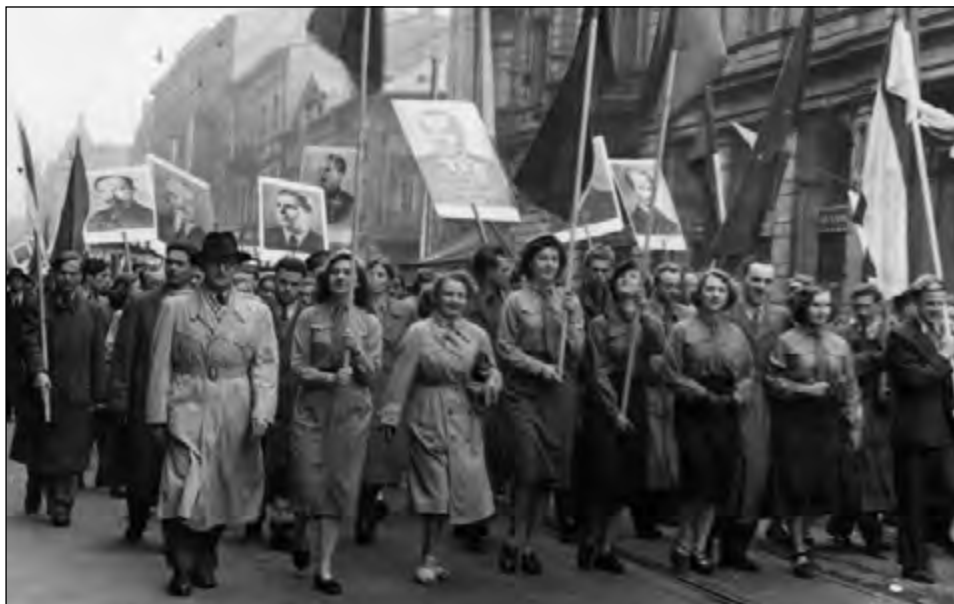
Fot. 74. Studenci i pracownicy UŁ na pochodzie 1 maja.

jedna z asystentek w Katedrze Marksizmu-Leninizmu, w przyszłości wybitna profesor, stwierdzała: „Wszystkie przedmioty są o tyle naukowe, o ile są ideologiczne” 23 . Te dogmatyczne poglądy, tak charakterystyczne dla tamtych lat, przetrwały do roku 1956.