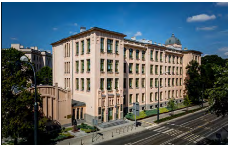
Fot. 65. Rektorat UŁ od 2016 r. po remoncie budynku dawnej Szkoły Zgromadzenia Kupców Miasta Łodzi