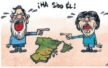
Figura 10.

Otra ola de críticas por parte de los viñetistas cae sobre el propio Puigdemont, a quien se lo dibuja destacando su falta de respeto a la Constitución, así como atacando su aspiración por la independencia catalana sin tener en cuenta los principios de convivencia democrática. Los humoristas gráficos cuestionan también la veracidad de este político y la incongruencia en su comportamiento. De ahí que metaforicen a Puigdemont como: NAPOLEÓN, PADRE ALIMENTANDO AL ODIOS (su niño), ALBAÑIL ELEVANDO UN MURO (antidiálogo), ACTOR ENSAYANDO SU PAPEL (de víctima), EQUILIBRISTA O ARTISTA DE CIRCO, entre muchos más.