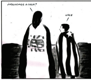
Figura 9. (El Roto, El País , 31.10.2017)