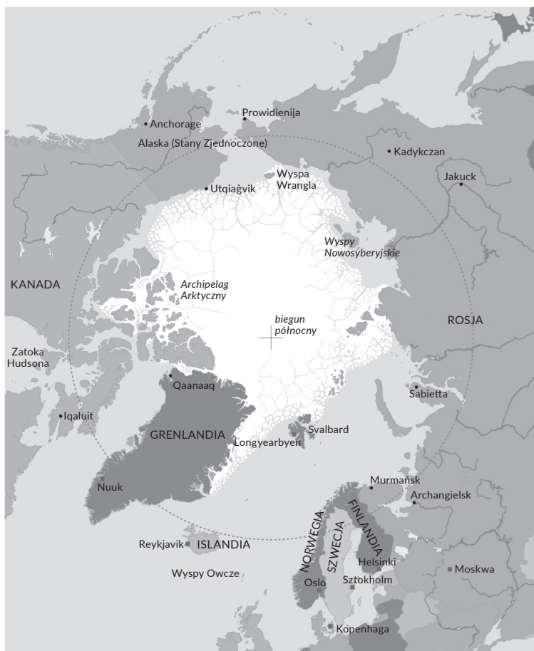
2a. Arktyka jako geopolityczny obszar okołobiegunowy

Słowo „Arktyka” pochodzi od greckiego słowa arktos , oznaczającego niedźwiedzia, i nawiązuje do nazwy gwiazdozbioru Wielkiej Niedźwiedzicy ( Ursa Major ), który jest cały czas widoczny na niebie półkuli północnej. W greckiej mitologii gwiazdozbiór ten jest dziełem Hery, żony Zeusa, która z zawiści i w gniewie zamieniła piękną nimfę Calisto w niedźwiedzicę. Gwiazda Północna lub Polarna znajduje się bezpośrednio nad arktycznym biegunem i wszystkie inne gwiazdy obracają się na nocnym niebie wokół niego.