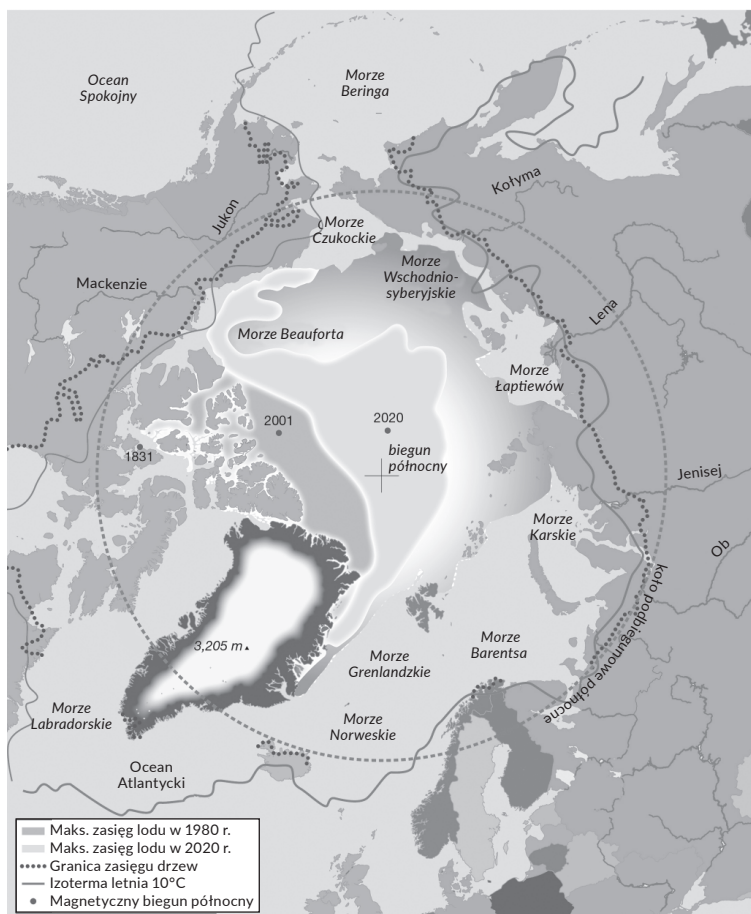
2b. Arktyka zdefiniowana na podstawie fizycznych i biogeograficznych parametrów

Koło podbiegunowe wyznacza najbardziej wysunięty na południe punkt, w którym 24 godziny trwa dzień podczas letniego przesilenia w czerwcu i 24-godzinna jest noc podczas zimowego przesilenia w grudniu. Od końca grudnia dzień w Arktyce staje się dłuższy, a od końca stycznia ciemności mogą nie pojawić się aż do wczesnego popołudnia. Wielu mieszkańców Arktyki potwierdza, że wiosna i lato są wyjątkowymi okresami po długiej, chłodnej i ciemnej zimie.