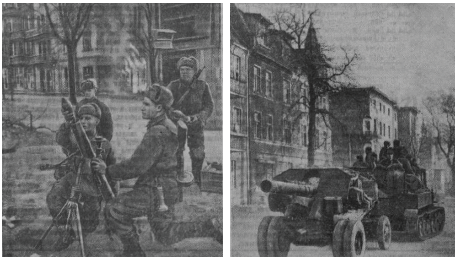
Рис. 1.

Pierwsze fotografie, wykonane przez Łoskutowa w Gdańsku, pokazały się w gazecie 1 kwietnia. Wówczas jego zdjęcia umieszczono na drugiej i trzeciej stronie. Pierwsze ukazywało czołg na nabrzeżu portowym, w pobliżu dźwigów i na tle dymiących hal. Drugie było wykonane „na jednej z ulic miasta, w dniu jego wyzwolenia od niemieckich najeźdźców” i prezentowało grupę cywilnych mieszkańców, z płonącą kamienicą w tle (ryc. 2) 47 .