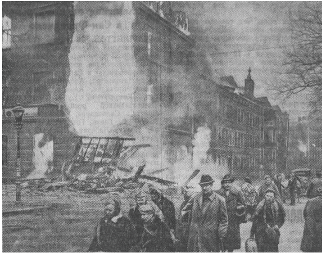
Рис. 2.

budynku w propagandowym geście, dokonanych przez żołnierzy z podległego Stalinowi „ludowego” Wojska Polskiego. Warto dodać, że obiekt ten został w kolejnych dniach władzy sowieckiej komendantury wojennej spalony i zrujnowany. Drugie ze zdjęć w tym zestawie prezentowało żołnierza sowieckiego wiwatującego na zdobytym wybrzeżu (rys. 3) 50 .