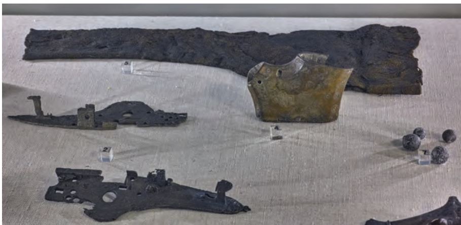
Рис. 10. Предметы вооружения стрельцов Стремянного полка. Экспозиция „Музея археологии Москвы” – Музейного Объединения „Музей Москвы”

бычьим пузырем, как это было у менее обеспеченных горожан. Стоявшие в домах печи были изразцовыми, цвет изразцов соответствовал моде того времени. Милитаристская тематика соответствовала вкусам хозяев домов и вполне могла использоваться как своего рода наглядное пособие для первоначального знакомства маленьких мальчиков с военным делом. Хотя мы и не знаем были ли эти изразцовые печи сюжетными рассказами в картинках, но можно полагать, что с их помощью маленьким мальчикам отец мог рассказать о своей службе или даже составить связанное повествование о военных приключениях. Обнаруженные фрагменты привозных глиняных сосудов, так называемый „каменный рейнский товар” 22 свидетельствует, о том, что в быту эти стрельцы не исповедовали изоляционизм. Быт этих людей рисует картину заинтересованности в окружающем мире и их открытость некоторым новациям и чужеземным влияниям. Обилие находок фрагментов кожаной обуви подтверждает известный факт, что русские горожане носили в основном кожаную обувь, как взрослые, так и дети. В культурном слое Стремянной слободы сохранились детские глиняные игрушки, фрагменты кожаного мяча и деревянный меч, прекрасно сохранившийся.