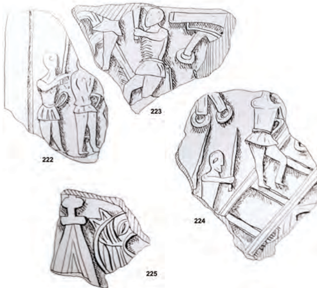
Рис. 7. Зарисовки печных изразцов. Археологическая полевая документация (собрание Музея Москвы)