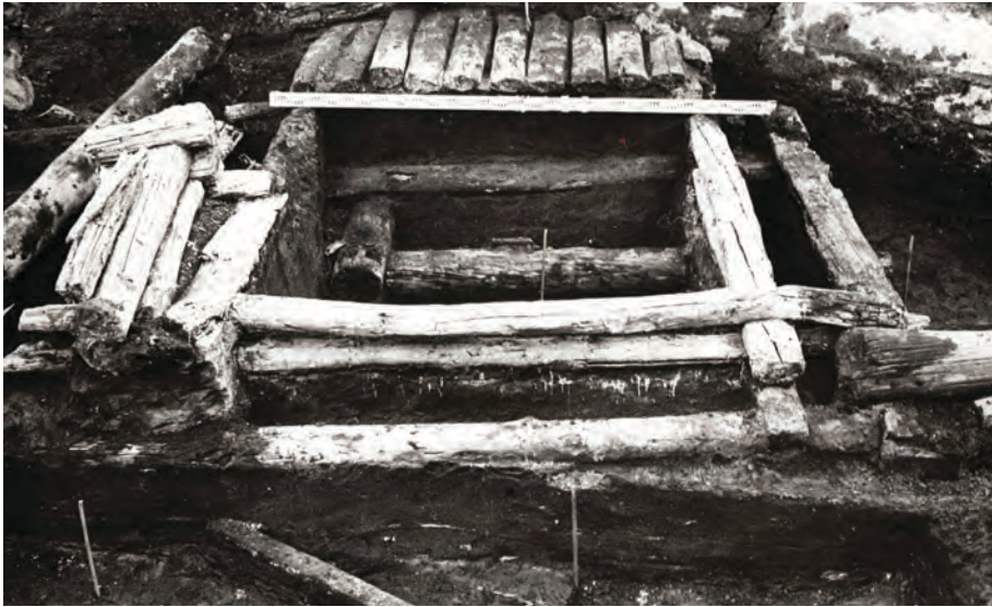
Рис. 4. Элементы городской инфраструктуры. Колодец