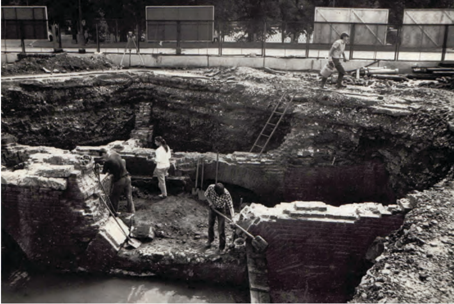
Рис. 6. Элементы поздней городской застройки, перекрывающие более ранние культурные слои