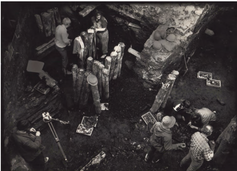
Рис. 5. Элементы городской инфраструктуры