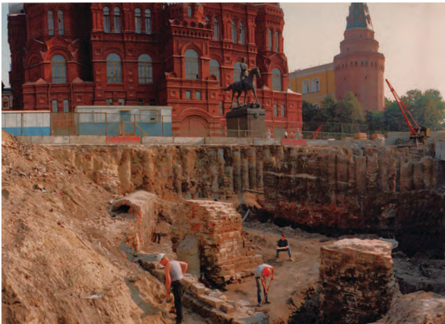
Рис. 2. Раскопки на Манежной площади 1993–1996 гг. Вид на выявленные устои Воскресенского моста (XVIII в.) через реку Неглинную