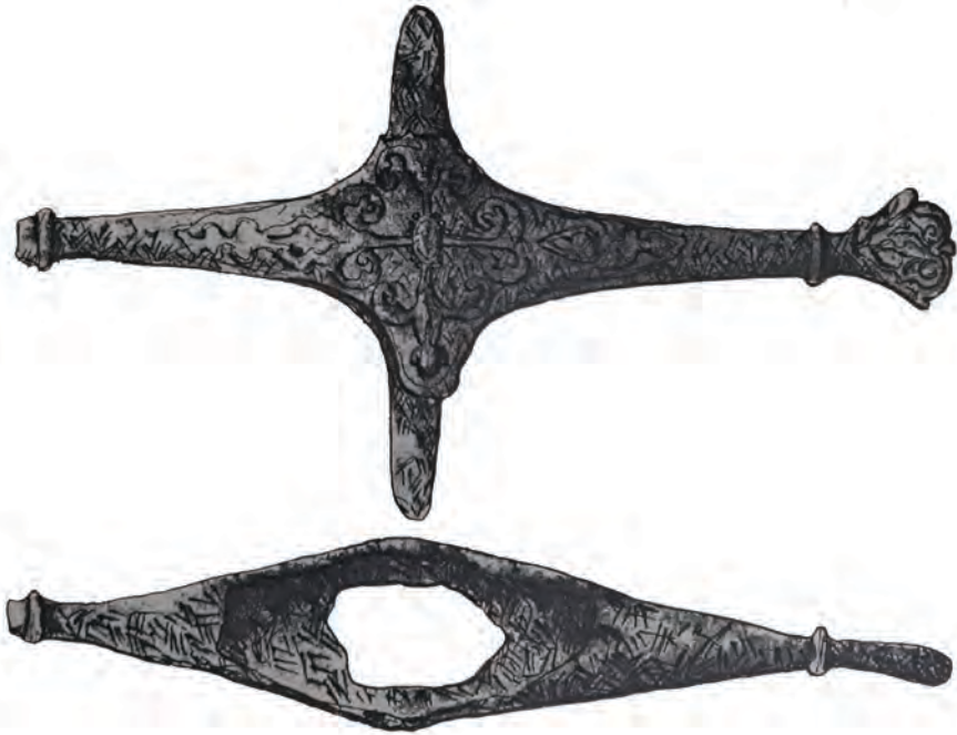
Рис. 8. Графическая фиксация перекрестия сабли. Археологическая полевая документация (собрание Музея Москвы)