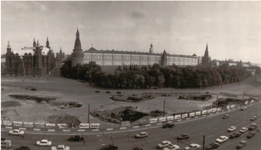
Рис. 1. Раскопки на Манежной площади 1993–1996 гг. Общий вид