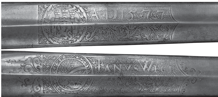
Рис. 2. Изображения и надписи на плоскостях клинка на мече (ЛИМ, инв. № 3-3477. Фот.: Д. Тоичкин)

на северо-востоке Венгерского королевства 9 . В разных вариантах написания, название города состояло из двух частей – первая была названием комитата, вторая – города. Возможно, с этим связана заглавная литера „М” перед „SIGIETA”.