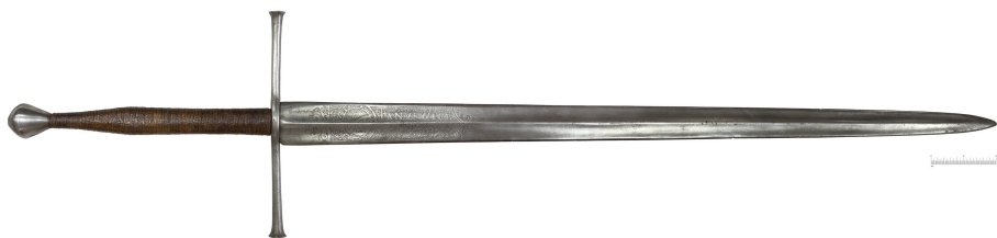
Рис. 1. Меч „бастард”, Львов (?), XVI в. (ЛИМ, инв. № 3-3477. Фот.: Д. Тоичкин)

В собрании ЛИМ представлен длинный „полторный” меч „бастард” (инв. № 3–3477), являющийся поздней разновидностью так называемых „больших мечей” XVI в. (рис. 1).