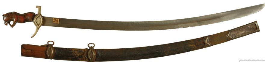
Рис. 4. Церемониальная сабля XVIII в. (ЛИМ, инв. № 3-3479. Фот.: Д. Тоичкин)

Другой выразительно декорированный образец (ЛИМ, инв. № 3-3479, рис. 4) – сабля, относится к значительно более позднему периоду. Сабля поступила в музей в 1940-х гг. Общая длина – 990 мм, длина клинка – 845 мм, ширина клинка возле пяты – 36 мм. Более трети последней части клинка имеет плавное (без уступчатого перехода) расширение, т.н. „перо”. Боевой конец двулезвийный, радикально скруглен к острию, расположенному на обухе. Судя по всему, когда-то конец клинка был обломан и, затем, восстановлен уже в представленном виде. Об этом же свидетельствует длина ножен, ощутимо превышающая длину клинка.