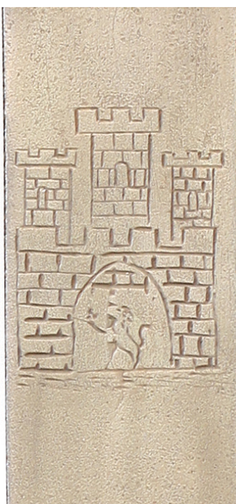
Рис. 9. Гербы Львова на клинковом оружии из коллекции ЛИМ: а – на клинке сабле XVII в.; б – на клинке сабли XVIII в., инв. № 3-3480; в – на палашах второй пол. XIX в., инв. №№ 3-1183, 3-1215