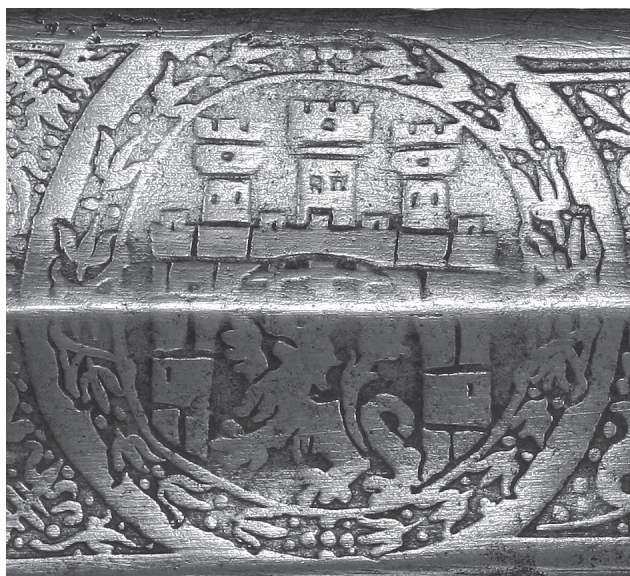
Рис. 3. Герб Львова на плоскости клинка на мече (ЛИМ, инв. № 3-3477. Фот.: Д. Тоичкин)

печатах) традиционно представляла модификацию городского герба, в частности, количество башен было уменьшено до одной 14 . На мече же изображен полноценный городской герб. Тем не менее, появление герба на клинке действительно может свидетельствовать о функционировании меча в структурах городского либо цехового самоуправления и его церемониальном значении. Известно, что после завоевания Львова Польским королевством, указанный городской символ стал необычайно популярен в городской среде: он широко использовался не только на печатах, но и на знаменах, цеховых знаках, им метили топленый воск и различные изделия, даже украшали фасады домов 15 .