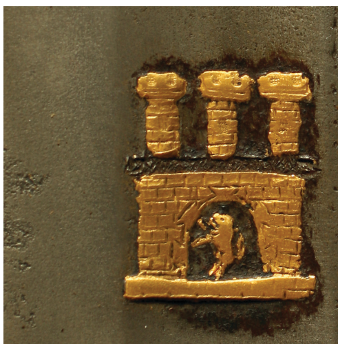
Рис. 6. Герб Львова на внешней стороне клинка церемониальной сабли XVIII в. (ЛИМ, инв. № 3-3479. Фот.: Д. Тоичкин)

герб, аналогичный ранее рассмотренному на мече, но с некоторыми отличиями. Наиболее очевидное – все три башни имеют одинаковый размер. Такое исполнение можно встретить еще в печатных изданиях Ивана Федоровича, в частности, в первой напечатанной им во Львове книге Апостол 1574 г.