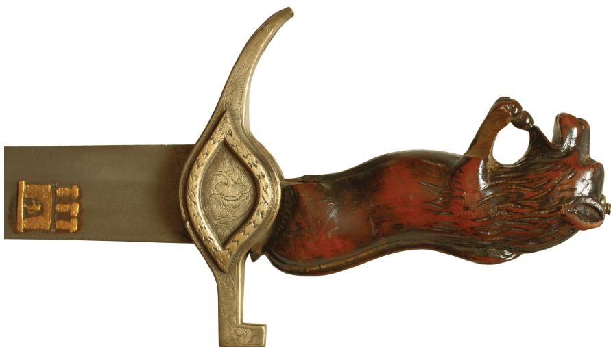
Рис. 5. Эфес церемониальной сабли XVIII в. (ЛИМ, инв. № 3-3479. Фот.: Д. Тоичкин)

Ножны деревянные, обтянутые черной кожей, на которой тиснением выполнен растительно-геометрический орнамент. Металлический прибор выполнен из белого золота и состоит из устья (утрачено), двух линзовидных обоймиц с неподвижными кольцами, кольца-шеврона и массивного наконечника. Металлические части ножен декорированы растительным орнаментом в едином стиле с гардой.