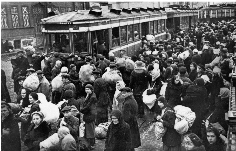
Ил. 2. Посадка на трамвай жителей, эвакуируемых из Кировского района. 18 сентября 1941 г.

9 сентября противник силами 1-й пехотной дивизии начал наступление на село Русско-Высоцкое, где Нарвское шоссе перехватывалось полосой обороны Красногвардейского укрепленного района. Здесь его встретили части 3-й гвардейской дивизии народного ополчения при поддержке трех отдельных пулеметно-артиллерийских батальонов, также состоявших из ленинградских ополченцев. Чтобы прорвать советские укрепления, немцы собрали перед Русско-Высоцким мощный артиллерийский кулак, включавший все возможные орудия вплоть до зенитных. Несмотря на это, преодолеть советскую оборону в течение 9 сентября враг не сумел.