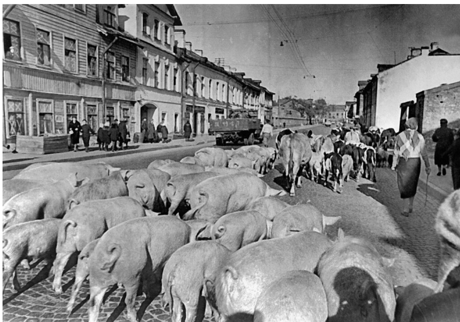
Ил. 1. Угон скота из Ленинградской области. Кировский район, Новосивковская улица (сейчас улица Ивана Черных). 17 сентября 1941 г.

30 июня 1941 г. начала формироваться Ленинградская армия народного ополчения. В первые недели войны многие ленинградцы, в том числе жители Кировского района, добровольно записались в народное ополчение. Из них было сформировано несколько дивизий, которые стали тем резервом, который прикрыл город в самые тяжелые моменты вражеского наступления. Всего к концу сентября 1941 г. в Ленинграде было сформировано 10 дивизий народного ополчения, 14 пулеметно-артиллерийских батальонов, 7 истребительно-партизанских полков, несколько истребительных батальонов и других формирований, в общей сложности насчитывавших около 160 000 человек 5 . Первой в Ленинграде была сформирована 1-я дивизия народного ополчения, состоявшая из добровольцев Кировского района. Ее формирование проходило в здании Дома культуры имени Горького. 1-й полк формировал Кировский завод, 2-й полк – Судостроительный завод