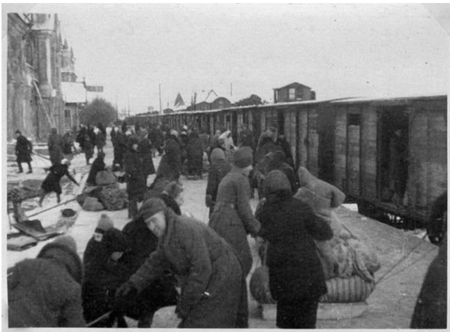
Ил. 9. Посадка в поезд на Красносельском вокзале. 1943 г.

были возведены настолько качественно, что в мирное время их не всегда удавалось демонтировать. Иногда приходилось отрывать рядом с дотом котлован и хоронить в нем все сооружение целиком. Отчасти в связи с этим обстоятельством значительное количество дотов «Ижоры» сохранилось до нашего времени (ил. 8). В 2015 г. все сохранившиеся сооружения оборонительного рубежа «Ижора» (36 дотов) были признаны комплексным объектом культурного наследия регионального значения. Дот № 112 у дома 79 по проспекту Стачек, представлявший собой пулеметную огневую точку с амбразурой под казематную шаровую 7,62-мм пулеметную установку, в настоящее время музеефицирован 14 .