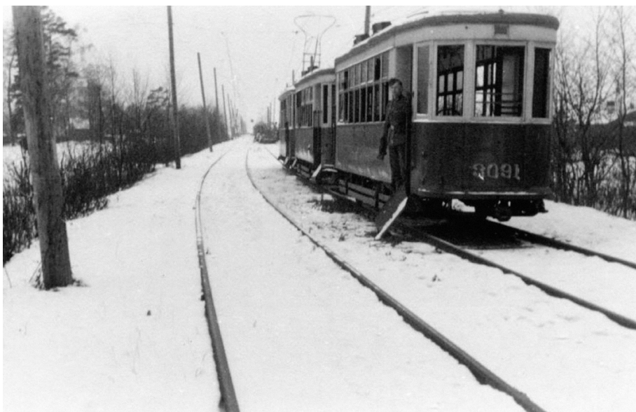
Ил. 5. Немецкий солдат на подножке вагона ЛП-33 на Петергофском шоссе. 1941/1942 г.

проблемой для жителей было отсутствие продовольствия. Немцы не собирались кормить местное население, наоборот, они использовали продовольственные запасы в своих интересах. Осенью 1941 г., параллельно с голодом, который начинался в блокированном Ленинграде, начался голод и в оккупированных пригородах. Жители деревень использовали спрятанные запасы, у горожан такие запасы были не всегда. Считается, что в Красносельском районе в его прежних границах, т. е. с Русско-Высоцким, Ропшей, Кипенью и т. д., за время оккупации 2355 человек умерло от голода, 2885 погибло от бомб и снарядов.