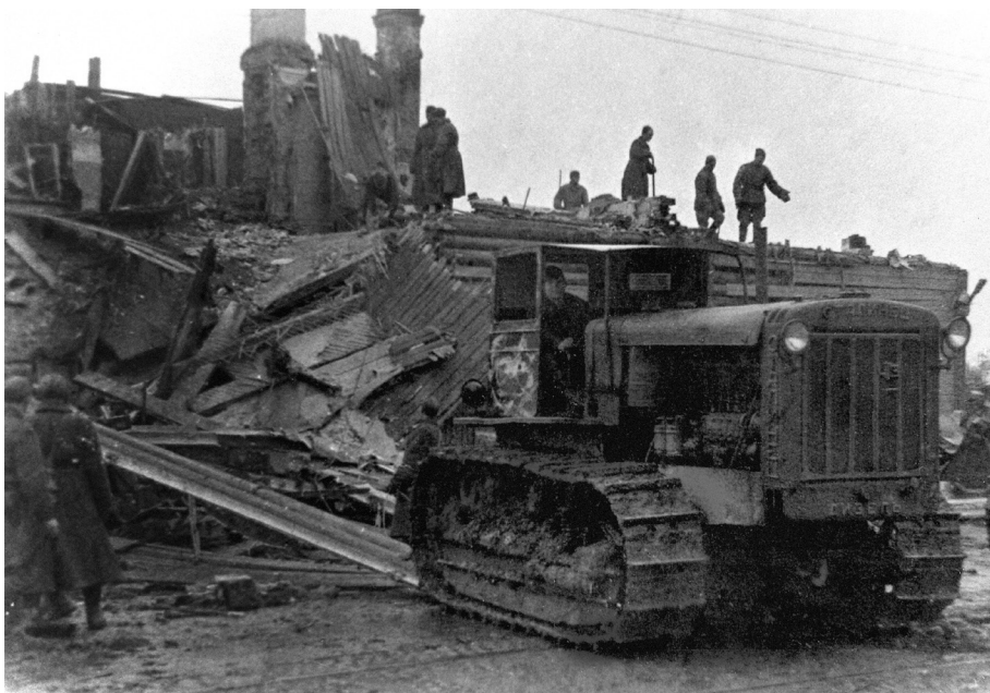
Ил. 7. Слом деревянного дома на дрова на проспекте Стачек в Кировском районе. Сентябрь 1942 г.

обеспечить тщательную фильтрацию задержанных детей, и тех из них, которые не имеют родителей, направлять в ближайшие детские приемники-распределители. Чтобы спасти их от гибели, а также чтобы предотвратить детскую и подростковую преступность, малышей передавали в детские дома, для ребят постарше открывали ремесленные училища и фабрично-заводские школы. Подростки с 14 лет могли работать. Детей, чьи судьбы были искалечены войной, старались, насколько это было возможно, вернуть к нормальной жизни в обществе 13 .