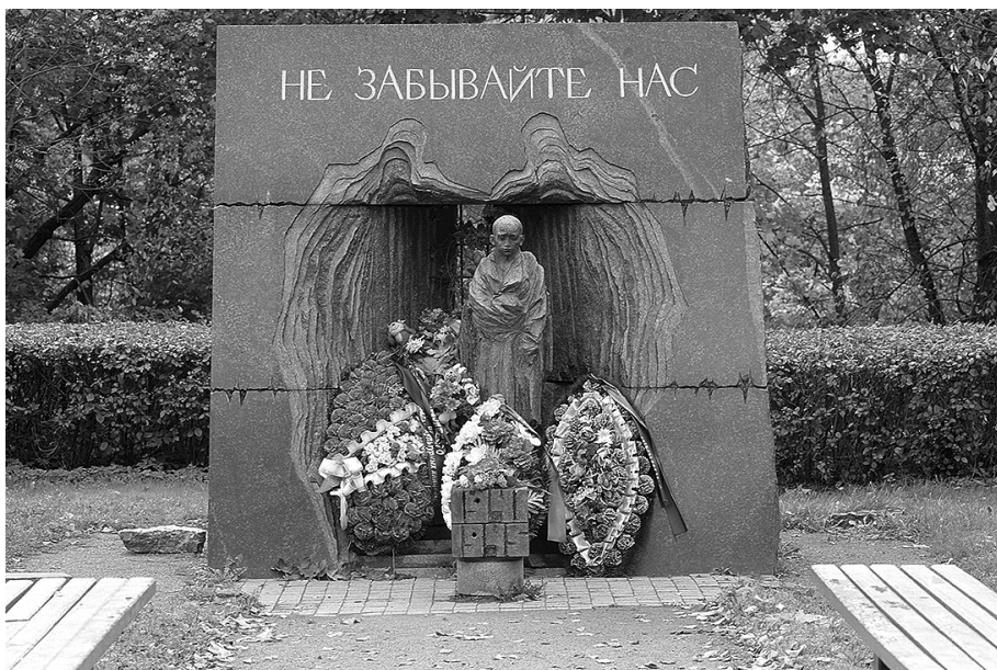
Ил. 11. Памятник детям-узникам нацистских концлагерей в Красном Селе

в начале 1960-х гг. начался процесс массового жилищного строительства, полностью изменивший облик этих мест 17 .