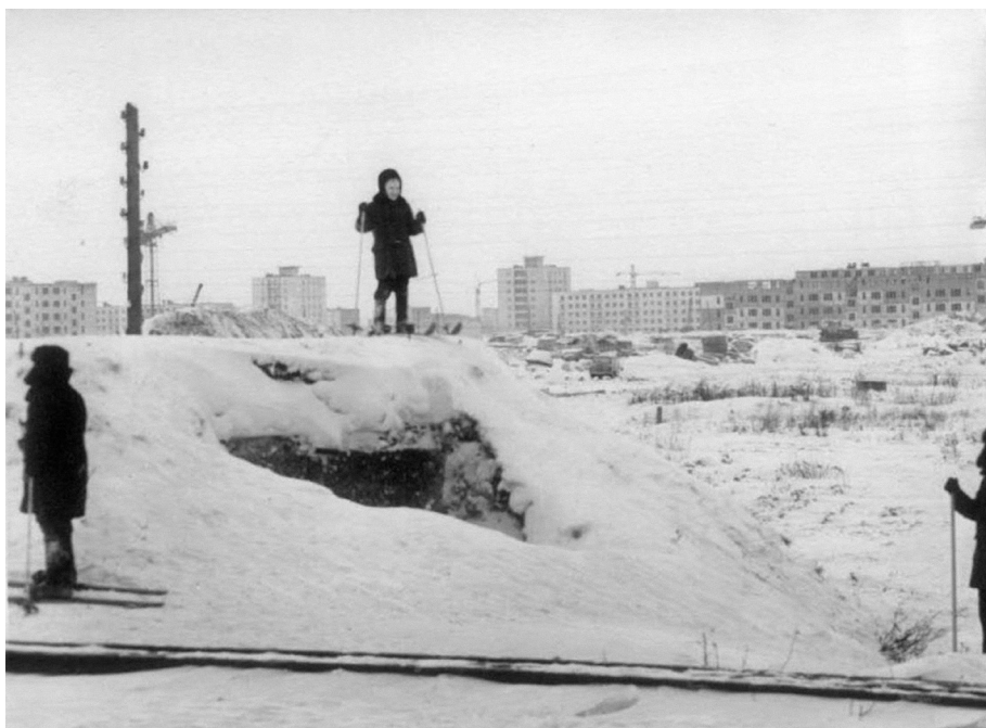
Ил. 8. Дот, стоявший на бывшей линии обороны Ленинграда. 15 января 1963 г.

была проведена огромная работа по совершенствованию обороны, в ходе которой был сооружен пояс капитальных оборонительных сооружений из бетона на тыловом рубеже 42-й и 55-й армий, получивший условное название «Ижора». Рубеж начинался в Угольной гавани, его головной участок проходил по земле Кировского района. Железобетонные укрепления, которые по качеству многократно превосходили кустарно возведенные укрепления 1941–1942 гг., сооружали стройармейцы, в первую очередь женщины. На строительстве оборонительной линии трудились около 2000 человек, причем работать приходилось под огнем противника, передний край которого находился на расстоянии от 800 м до 5 км. При возведении рубежа «Ижора» было убито и ранено более 100 человек. Всего к 1 октября было построено 119 фортификационных сооружений, в том числе 92 железобетонных артиллерийских и пулеметных дота, оснащенных современным оружием и всеми средствами жизнеобеспечения. Капитальные железобетонные сооружения рубежа «Ижора»