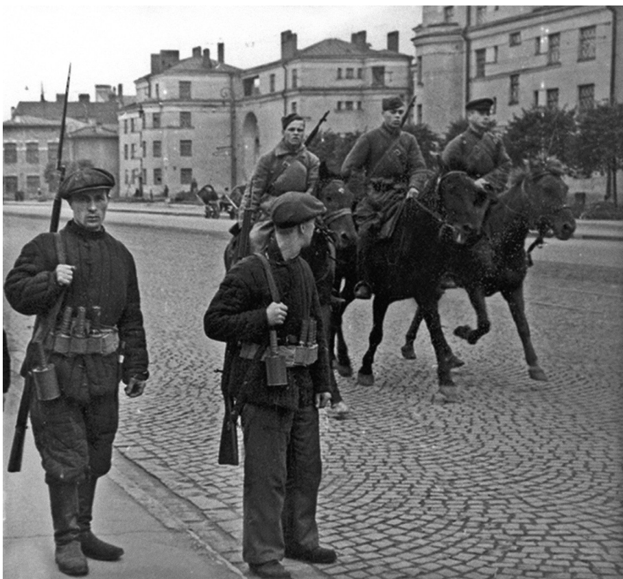
Ил. 4. Патруль рабочих Кировского завода и красноармейский разъезд на проспекте Стачек. 1941 г. Август 1941 г. (Ленинград в борьбе месяц за месяцем. 1941–1944, Санкт-Петербург 1993)

красноармейцев. Однако во время артобстрела была повреждена электрическая подстанция, и контактная сеть была обесточена. Трамваи встали там, где их застало отключение, и были оставлены. Из-за быстрого продвижения немцев конечный участок трамвайной линии от Привала до Стрельны с оставшимися на нем вагонами оказался на оккупированной территории. Немецкие военнослужащие очень любили фотографироваться у этих вагонов, хвастаясь в своих письмах в «фатерлянд», что они-де уже в Ленинграде (ил. 5). Возможно, это породило легенду о мирном трамвае с горожанами, который якобы был варварски расстрелян наступающими фашистами. На Петергофском шоссе вагоны простояли до освобождения этих мест в 1944 г. К моменту снятия