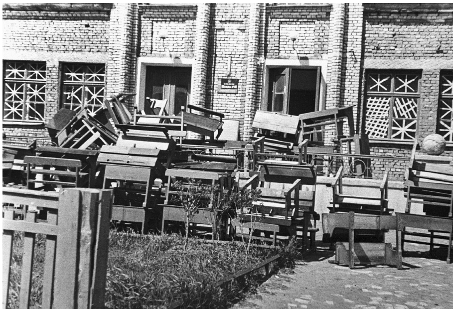
Ил. 3. Подготовка одной из школ Кировского района под лазарет. 27 июня 1941 г.

готовые развить успех. Резервов, чтобы отразить этот удар, у командования советской 42-й армии не было. 10 сентября 1941 г. противник вышел на ближние подступы к Красному Селу. К 11 сентября немцам удалось преодолеть линию обороны Красносельского сектора и начать продвижение по Нарвскому шоссе. 36-я моторизованная дивизия заняла Дудергоф и территорию лагеря под Вороньей горой 7 .