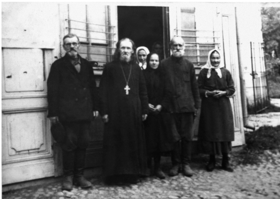
Ил. 6. У входа в церковь Св. Троицы. Красное Село. 1943 г.

боев строились баррикады, перекрывающие основные проезды. В угловых домах оборудовались пулеметные гнезда и амбразуры для орудий. Сооружались доты – долговременные огневые точки из железобетона. Большинство привлеченных к этим работам составляли женщины. К 23 сентября 1941 г. по 1-му сектору обороны Ленинграда (Кировский и Ленинский районы) было вырыто или создано тысячи погонных метров противотанковых рвов, эскарпов, окопов и «противотанковых ловушек», организованы командные пункты, поставлены железобетонные надолбы, устроены 16 930 проволочных заграждений в один, три и пять рядов кольев. Заложены фугасные снаряды и более 20 тысяч мин. Созданы десятки дзотов для 76-мм и 45-мм орудий и пулеметов.